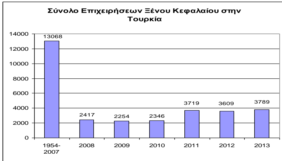
Διάγραμμα 3: Σύνολο Επιχειρήσεων Ξένου Κεφαλαίου την Τουρκία