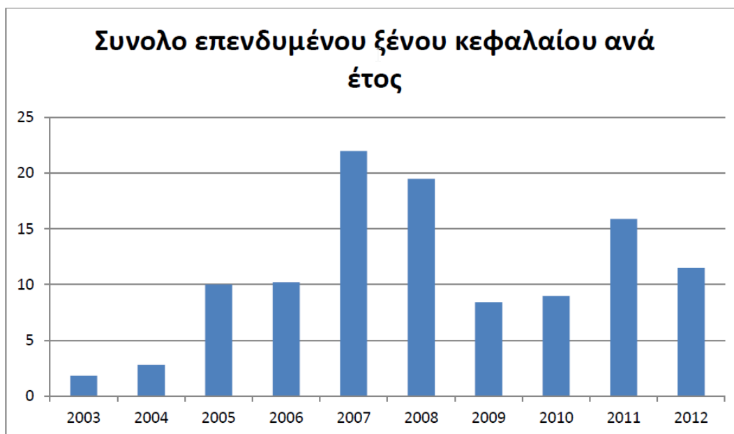
Διάγραμμα 2: Άμεσες Ξένες Επενδύσεις στην Τουρκία