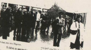
Μέχρι και την Πέμπτη

Κλειστό παραμένει από αύριο και μέχρι την επόμενη Πέμπτη οι υπηρεσίες της καθημερινής διακίνησης του ΤΕΙ Θεσσαλονίκης.