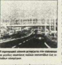
Η ατμοσφαιρική ρύπανση μεταφέρεται στην περιοχή...