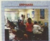
Πράξη η e-μάθηση