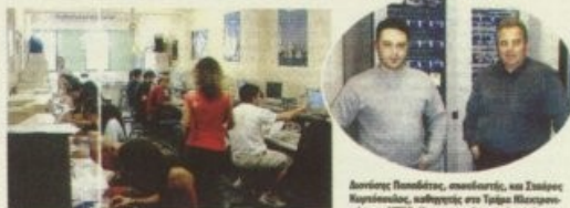
Ο κύριος των τεχνολογιών του Τμήματος Ηλεκτρονικής...