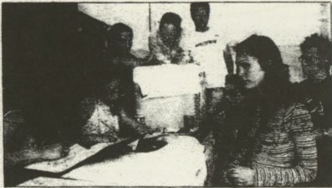
Σήμερα αναμένεται να ανάγει το κλίμα, ενώ η των φοιτητικών εκλογών της 13ης Απριλίου, στο Αριστοτέλειο και το Πανεπιστήμιο Μακεδονίας, καθώς το προηγούμενο διάστημα ήταν ιδιαίτερα υστιαστικό.

Οι φοιτητικές παρατάξεις παίζουν το τελευταίο χαρτάκι τους με τις πολιτικές φιλοδοξίες αλλά και τις συναισθηματικές