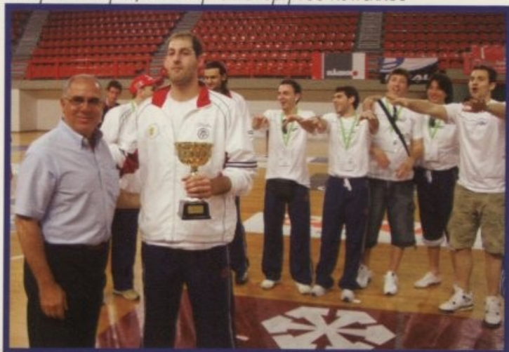
Οι πρωταθλητές κατά την απονομή του κυπέλλου