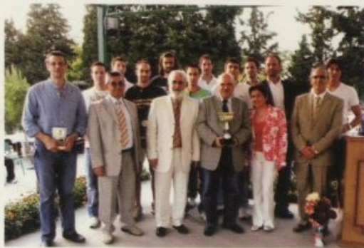
Από τη βράβευση της πρωταθλήτριας Ελλάδας, ομάδας καλαθοσφαίρισης του ΑΤΕΙΘ.

πλευρα, γ) να ενισχυθεί η επικοινωνία και η συνεργασία του Α.Τ.Ε.Ι.-Θ με φορείς της κοινωνίας, της αγοράς και της δημόσιας διοίκησης. Ειδικότερα, με την εκδήλωση έγινε προσπάθεια για μια καλύτερη αυτεπίγνωση και εξωτερική σύνδεση του Εκπαιδευτικού Οργανισμού με όσους έχουν γνωστικά, ερευνητικά και επιχειρηματικά ενδιαφέροντα σχετικά με τις γεωργικές δραστηριότητες και την ύπαιθρο. Σε δώδεκα επιχειρηματικούς φορείς, δόθηκε η ευκαιρία να εκθέσουν προϊόντα τους, να γνωρίσουν το Α.Τ.Ε.Ι.-Θ. και τις δραστηριότητές του, να ανταλλάξουν απόψεις και να συνδεθούν με ερευνητές και εκπαιδευτικούς, να γνωρίσουν το χώρο, τις εκπαιδευτικές δραστηριότητες και τις άλλες υπηρεσίες της Σχολής και του Ιδρύματος γενικότερα. Στους επισκέπτες δόθηκε η δυνατότητα να γνωρίσουν τα Τμήματα της Σχολής, τις εγκαταστάσεις, τους χώρους, τις δραστηριότητες και κάποια δείγματα από τα εκπαιδευτικά, συγγραφικά, ερευνητικά αλλά και αθλητικά - καλλιτεχνικά αποτελέσματα.