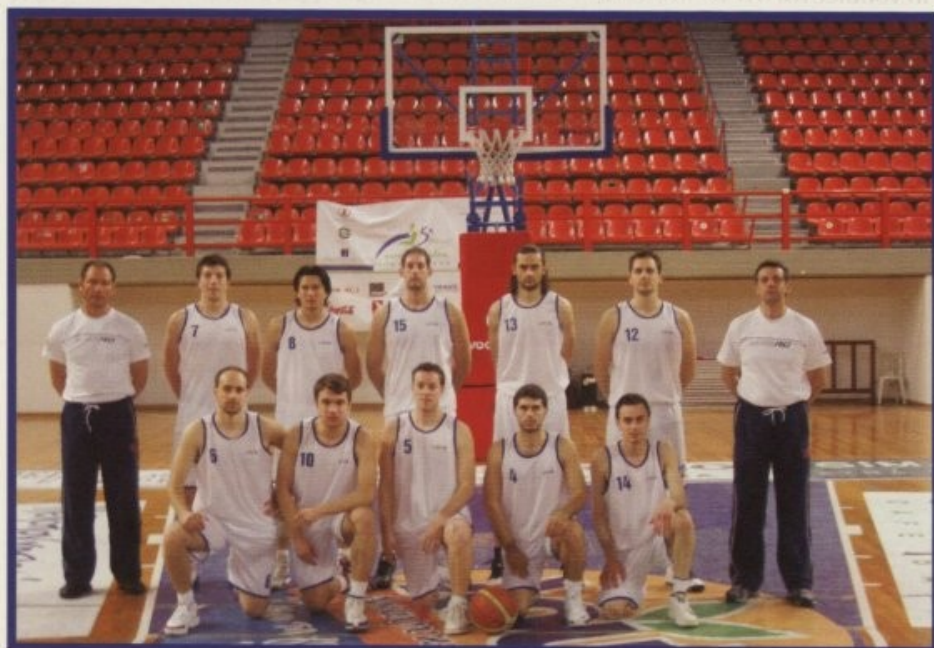
Η πρωταθλήτρια της "Πανεπιστημιάδας 2006", ομάδα καλαθοσφαίρισης του Α.Τ.Ε.Ι.Θ.

Στημιότυπα από την εκδήλωση της 22 Ιανουαρίου 2006 της Ένωσης Γονέων του Α' Δημοτικού Διαμερίσματος Θεσσαλονίκης στην αίθουσα τελετών της Παγκρήσιας Αδελφότητας Μακεδονίας, κατά την οποία έλαβε χώρα η τιμητική διάκριση του Σεβασμιότατου Μητροπολίτου Θεσσαλονίκης κ.κ. Άνθιμου και του κ. Γεωργίου Παλάτου εκπαιδευτικού του ΤΕΙ Θεσσαλονίκης και Προέδρου της Ομοσπονδίας Γονέων Ν. Θεσσαλονίκης.