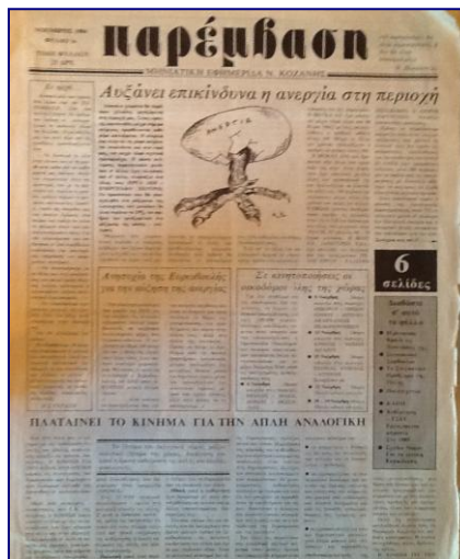
Εικόνα 1. 1 ο φύλλο της «Παρέμβασης»