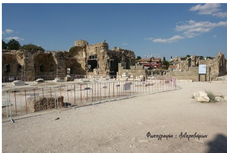
Εικόνα 15. Μεγάλη Βασιλική που χτίστηκε τα παλαιοχριστιανικά χρόνια.