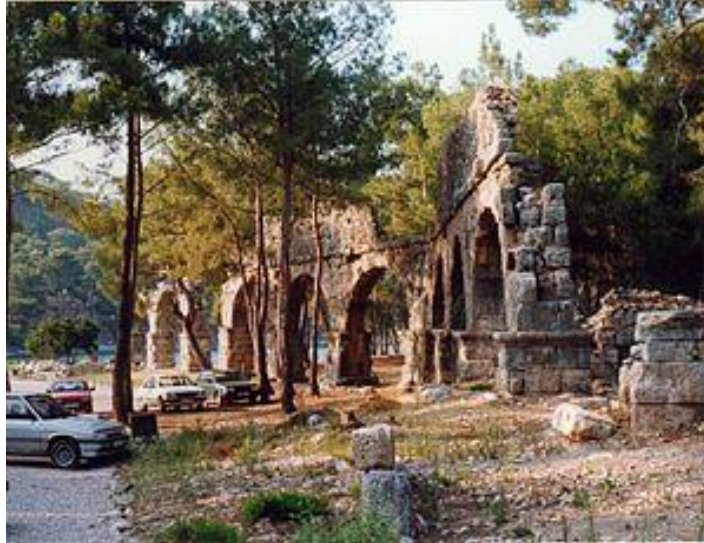
Εικόνα 13. Υδραγωγείο Ρωμαϊκής εποχής