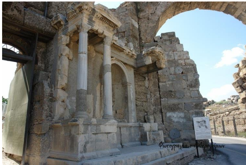
Εικόνα 17. Η αρχαία πύλη.