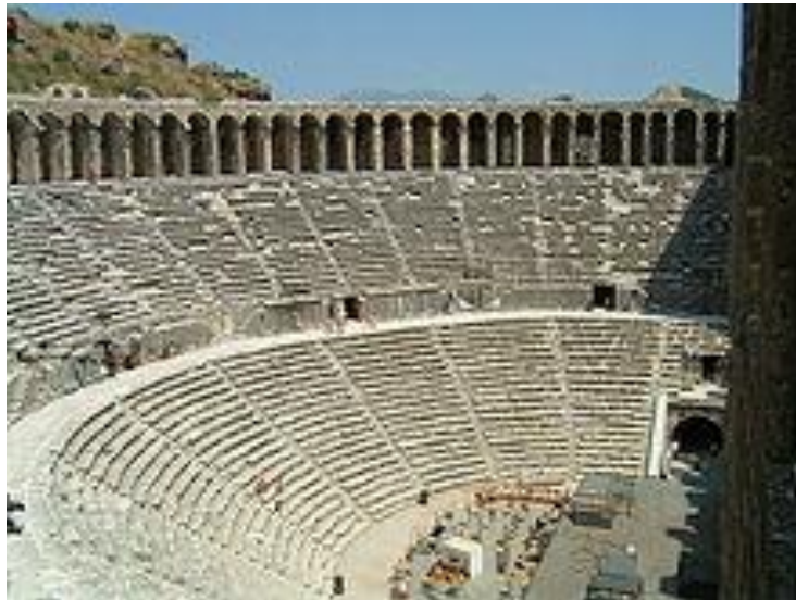
Εικόνα 10. Το αρχαίο θέατρο της Ασπένδου.

Κατά την Βυζαντινή περίοδο το θέατρο είχε μεταβληθεί αρχικά σε караβάν-σεράι (σταθμό караβανιών), αργότερα όμως μετά την κατάληψη της περιοχής από τους Σελτζούκους αποτελούσε Σελτζουκικό ανάκτορο. Μέχρι πρόσφατα στο θέατρο αυτό παρουσιάζονταν διάφορα θερινά καλλιτεχνικά φεστιβάλ, λόγω όμως φθορών που σημειώθηκαν έχουν ανασταλεί παρόμοιες εκδηλώσεις, που συνεχίζονται όμως σε παρακείμενο κατάλληλα διαμορφωμένο χώρο [9], [18].