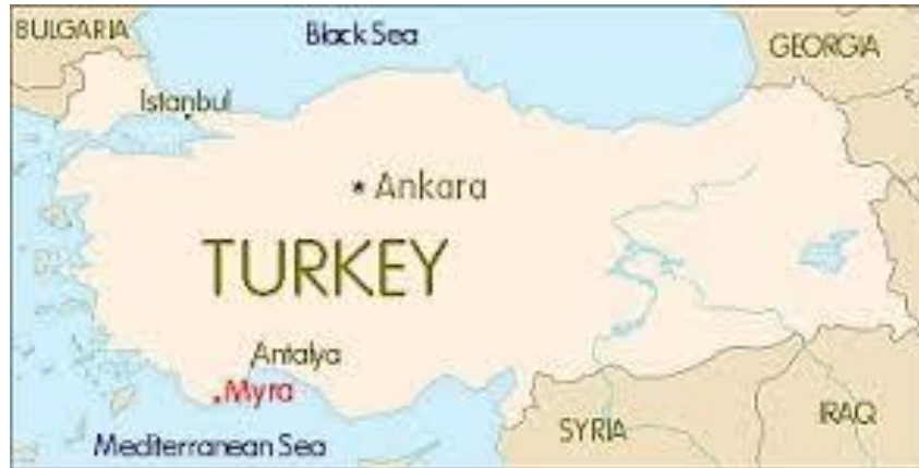
Εικόνα 7. Αττάλεια.