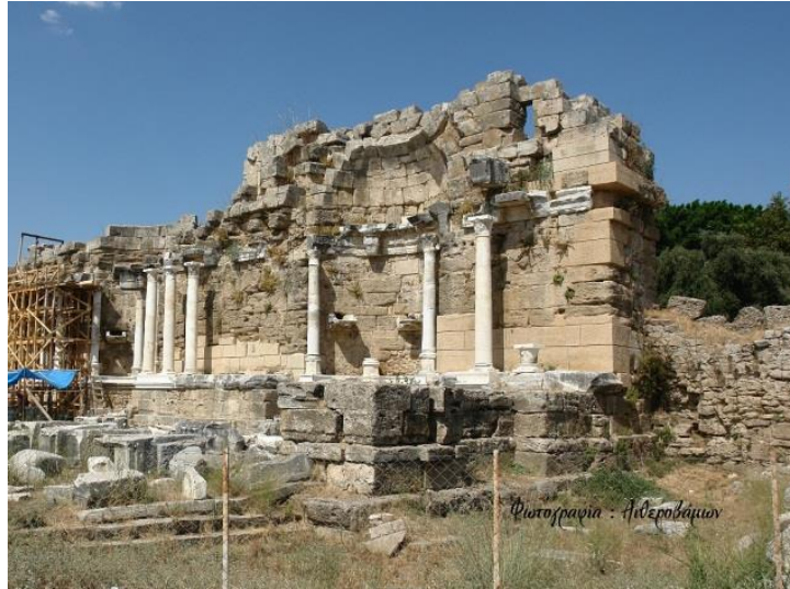
Εικόνα 16. Ρωμαϊκά κτίσματα που με την πάροδο του χρόνου έγιναν χριστιανικού ναοί.