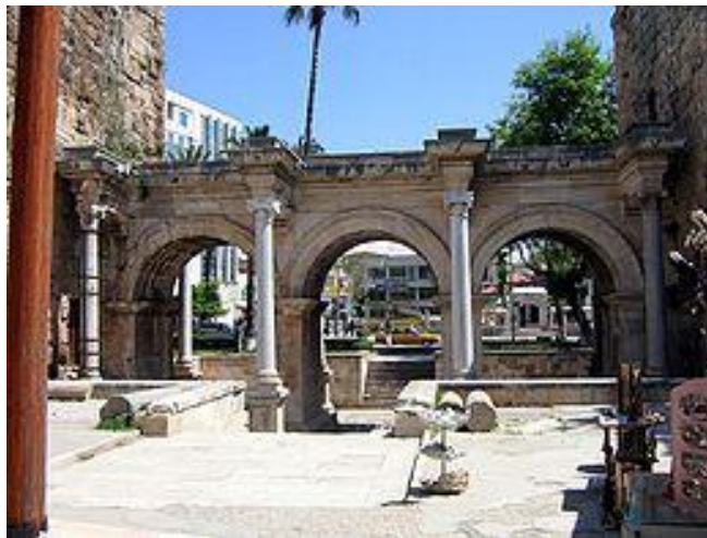
Εικόνα 8. Η πόλη του Ανδριανού στην Αττάλεια.