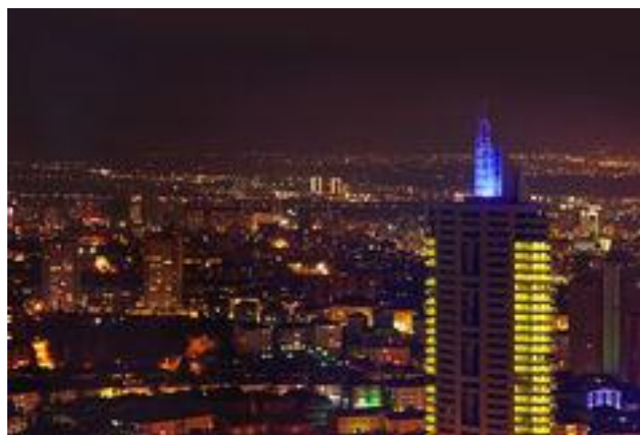
Εικόνα 1. Η Άγκυρα.

Πρωτεύουσα της Τουρκίας, αλλά δεύτερη σε πληθυσμό, είναι η Άγκυρα με 4.631.000 κατοίκους. Είναι κτισμένη στο κέντρο του οροπεδίου της Ανατολίας σε μικρή απόσταση από τη θέση της αρχαίας Χετταϊκής Ακρόπολης, όπου ήταν σταυροδρόμι περάσματος караβανιών.