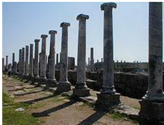
Εικόνα 11. Πέργη – Αρχαία αγορά.

Ερείπια της πόλης βρίσκονται σήμερα κοντά στην Αττάλεια, στα οποία ξεχωρίζουν τα τείχη της ακρόπολης της Πέργης μια πύλη θριάμβου, το μεγαλοπρεπές θέατρο, το στάδιο και πολλοί ναοί. Επίσης έχουν βρεθεί πολλά νομίσματα με αναπαράσταση το ιερό της Αρτέμιδας καθώς και πολλές αρχαίες επιγραφές. Από τη Πέργη καταγόταν ο αρχαίος Έλληνας, σπουδαίος μαθηματικός και αστρονόμος, Απολλώνιος ο Περγαίος [10].[18]