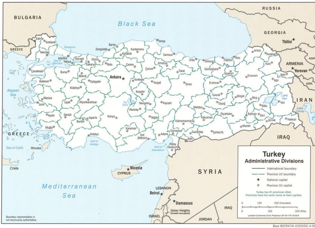
Εικόνα 5 . Διοικητική διαίρεση της Τουρκίας.

Είναι όμως φανερό πως πρέπει να υπολογιστούν και οι κοινωνικοπολιτικές εξελίξεις οι οποίες διαδραματίστηκαν μετά τη δεκαετία του 1950, στην ανάπτυξη του τούρκικου τουρισμού. Οι κοινωνικοπολιτικές εξελίξεις συνέβαλλαν σημαντικά στη πρόοδο του πολιτικού και οικονομικού τοπίου μέχρι και τη σημερινή Τουρκία. Έως το 1980 ο στρατός παρενέβη στα κοινά τρεις φορές λόγω της άσχημης οικονομικής κατάστασης, της ανεργίας και του τεράστιου εξωτερικού χρέους που επικρατούσε. Πρέπει να σημειωθεί πως η ανάπτυξη στην τουριστική βιομηχανία ήταν αποτέλεσμα οικονομικοπολιτικών προσεγγίσεων τόσο του στρατιωτικού κατεστημένου αλλά και των τούρκικων κυβερνήσεων μετά το 1980.[17]