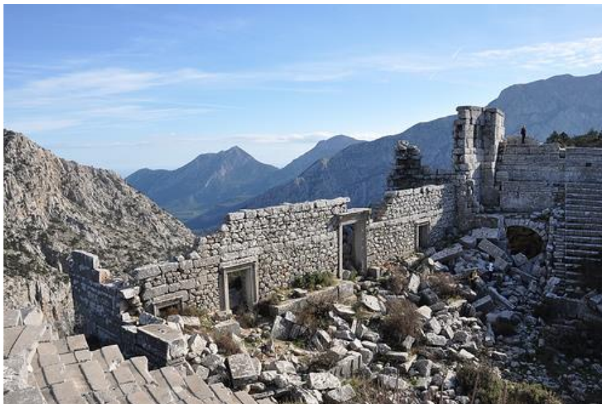
Εικόνα 11. Τερμησός.