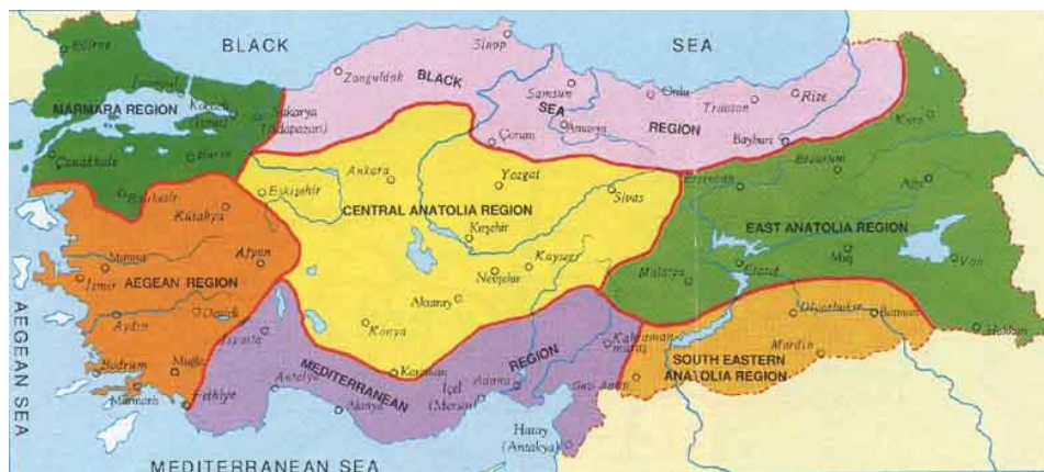
Εικόνα 6. Απεικόνιση των ευρύτερων γεωγραφικών διαμερισμάτων στα οποία διαιρείται η επικράτεια της χώρας (Πηγή:Κοτσανίδης, 2009).

Πρέπει να σημειωθεί πως τα τουριστικά συγκροτήματα κατασκευάστηκαν αλόγιστα στις περιοχές που καθορίστηκαν ως περιοχές τουριστικής ανάπτυξης που είχαν σαν αποτέλεσμα τον αντίστοιχο συγκεντρωτισμό και την τουριστική ζήτηση στις περιοχές αυτές [5].