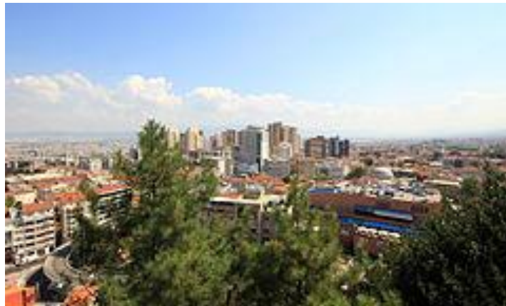
Εικόνα 4. Τα Άδανα

Η Προύσα (1.984.000 κατ.) στους πρόποδες του Ολύμπου, είναι παλιό κέντρο μεταξοβιομηχανίας. Υπήρξε η πρώτη πρωτεύουσα του Οσμανικού κράτους. Τα πολλά τεμένη, οι τάφοι των σουλτάνων και το μαυσωλείο του Σουλτάν Ομάν της δίνουν έντονο μουσουλμανικό χρώμα.