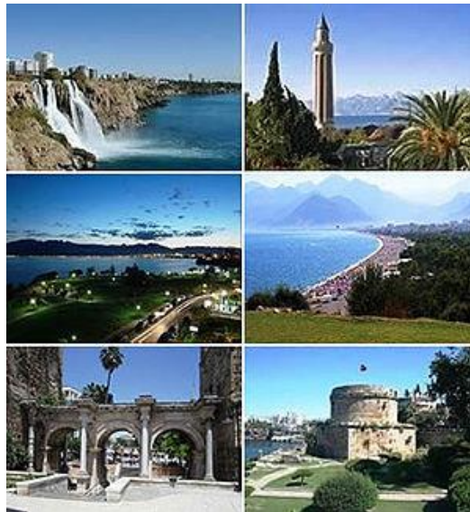
Εικόνα 9. Εικόνες από Αττάλεια.

Κατά τη βυζαντινή περίοδο η Αττάλεια ήταν η σημαντικότερη πόλη του ναυτικού θέματος Κιβυρραιωτών ή Καραβησιάνων και πιθανότατα πατρίδα του ιστορικού Μιχαήλ Ατταλειάτη. Η πόλη κατακτήθηκε από τους Σελτζούκους το 1207 και τον 14ο αιώνα έγινε η έδρα των μπέηδων του Τεκέ. Το 1361 την κατέλαβε ο βασιλιάς Πέτρος Α' της Κύπρου της δυναστείας των Λουζινιάν, αλλά το 1373 ο γιος του, Πέτρος Β' της Κύπρου, αναγκάστηκε να την εγκαταλείψει. Το 1423 οι Οθωμανοί κατέκτησαν το μπεϊλίκι του Τεκέ, διατηρώντας όμως την ονομασία για την επαρχία (σαντζάκι) της Αττάλειας. Με τη συνθήκη των Σεβρών η Αττάλεια βρέθηκε υπό την προσωρινή κατοχή της Ιταλίας. Με τη συνθήκη της Λωζάνης η πόλη περιήλθε ξανά σε τουρκική κυριαρχία και ο χριστιανικός πληθυσμός της την εγκατέλειψε. Η τουριστική ανάπτυξη της σύγχρονης Αττάλειας άρχισε από τη δεκαετία του 1970 και οδήγησε σε δεκαπλασιασμό του πληθυσμού της (από 100.000 τη δεκαετία του '70 σε ένα εκατομμύριο σύμφωνα με την απογραφή του 2012). Στη σημερινή ακτογραμμή δεσπόζουν μεγάλες ξενοδοχειακές μονάδες ενώ στην ευρύτερη περιοχή έχει εγκατασταθεί σημαντικός αριθμός ξένων πολιτών (κυρίως Γερμανών, Σκανδιναβών και Ρώσων) [18].