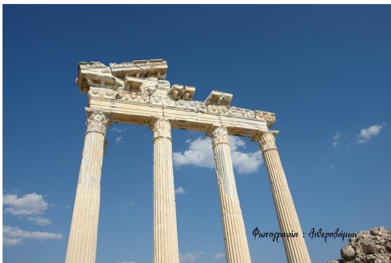
Εικόνα 14. Ο μεγαλοπρεπής ναός του Απόλλωνα που τμήμα της κιονοστοιχίας του αποκαταστάθηκε πρόσφατα. Μνημείο της Σίδης που βρίσκεται στην άκρη του λιμανιού.