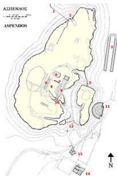
Εικόνα 12. Σχεδιάγραμμα της Αρχαίας Ασπένδου.

Από τα λείψανα της αρχαίας πόλης που βρίσκονται παρακείμενα του σημερινού λόφου Μπαλκίς πάρα τον ποταμό Μπάλκε Σου ή Κιοπρού Σου, (όπως λέγεται σήμερα ο αρχαίος Ευρυμέδοντας ποταμός), ξεχωρίζουν το αρχαίο ελληνορωμαϊκό θέατρο και το ρωμαϊκό υδραγωγείο.