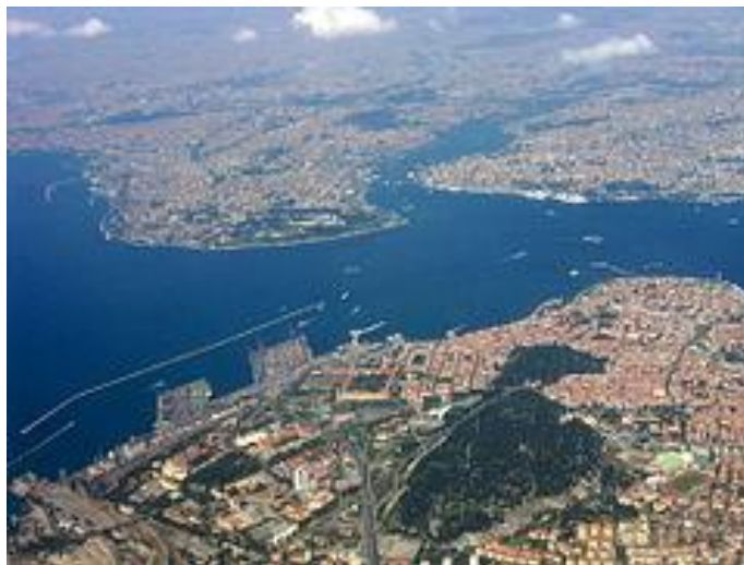
Εικόνα 2. Η Σμύρνη

Η μεγαλύτερη πόλη της Τουρκίας είναι η Κωνσταντινούπολη, με πληθυσμό 13.711.000 κατοίκους. Η σημερινή πόλη αποτελείται βασικά από τέσσερα τμήματα: Την παλαιά Πόλη, που έχει χτιστεί σε μια μικρή χερσόνησο μεταξύ Προποντίδας και Κερατίου Κόλπου, εκεί όπου βρισκόταν το αρχαίο Βυζάντιο, τη Νέα Πόλη (Γαλατάς και Πέραν), τις εξωτερικές συνοικίες μαζί με τα περίχωρα, και το τμήμα που βρίσκεται στο ασιατικό έδαφος. Στην παλιά πόλη, που έχει κτιστεί σε επτά λόφους, όπως και η αρχαία Ρώμη, βρίσκονται ο Ναός της Αγίας Σοφίας, πολλά βυζαντινά μνημεία, τεμένη, ανάκτορα των σουλτάνων, το πανεπιστήμιο και η ιστορική ελληνική συνοικία του Φαναρίου, όπου είναι και το ελληνικό Πατριαρχείο. Τη νέα και την παλιά πόλη συνδέουν δύο μεγάλες γέφυρες, η γέφυρα του Γαλατά και η γέφυρα του Ατατούρκ.[16]