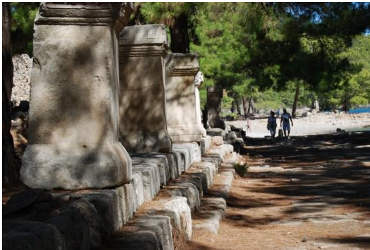
Εικόνα 12. Κύριος δρόμος στη Αρχαία Φασηλίδα.

Η Φασηλίδα (αρχ. Φασηλίδς), υπήρξε για πολλούς αιώνες ελληνική πόλη και σημαντικό λιμάνι στη νότιο Μικρά Ασία, απέναντι από την Κύπρο και δυτικά, κοντά στη σημερινή Αττάλεια, και είναι γνωστή κυρίως για την πολιορκία της από τους Έλληνες το 469 ή 466 π.Χ. κατά την εκστρατεία τους εναντίον των περσικών δυνάμεων που είχαν τότε συγκεντρωθεί στις εκβολές του Ευρυμέδοντα ποταμού. Τα χρόνια εκείνα η Φασηλίδα τελούσε υπό περσική κυριαρχία και οι Έλληνες προσπάθησαν και πέτυχαν να την αποσπάσουν από αυτήν. Οι περισσότεροι την ενέτασσαν τότε στην περιοχή της Λυκίας αν και μερικοί την ενέτασσαν στις Παμφυλίας, επειδή ήταν τρόπον τινά μεθοριακή πόλη. Παρά τη δωρική της καταγωγή, πάντως, υπήρξε στη συνέχεια για καιρό το ανατολικότερο σημείο ουσιαστικής αθηναϊκής επιρροής στα νότια παράλια της Μικράς Ασίας επί της Μεσογείου. Η στρατηγική της θέση και ο εξαιρετος ελλιμενισμός που προσέφερε την έκαναν να υποστεί πολλές επιδρομές και καταλήψεις, αλλά επιβίωσε ως ισχυρό εμπορικό λιμάνι μέχρι τον 11ο μ.Χ.. Ύστερα μαράζωσε είτε λόγω των πειρατών είτε λόγω γειτονικού έλους. Ρωμαϊκά ερείπια διασώζονται μέχρι σήμερα στην αρχαία θέση, η οποία βρίσκεται κοντά στο χωριό Τεκίροβα, στον κόλπο της Αττάλειας [11].