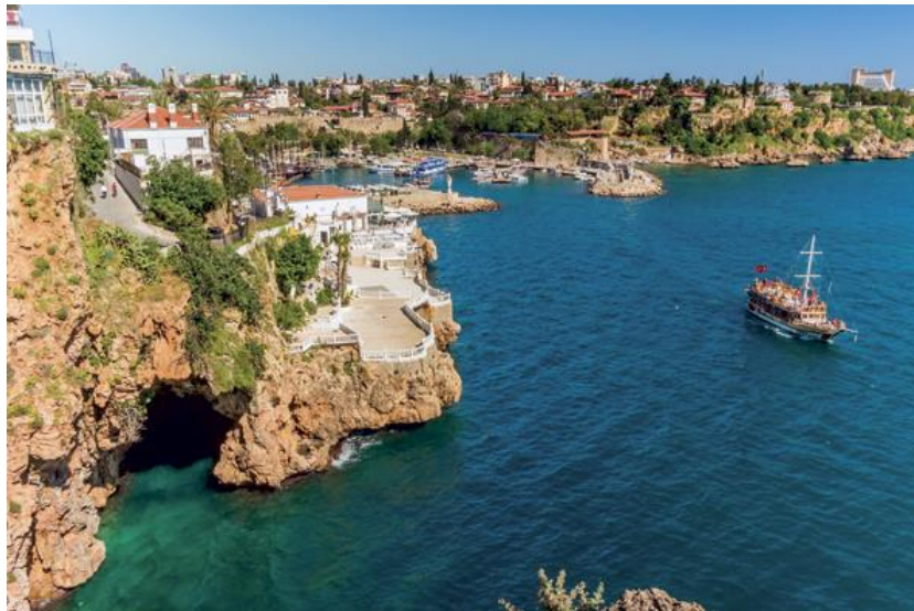
Εικόνα 10. Αττάλεια.

Τα ελληνικά σπίτια έχουν κριθεί ως ιδιαίτερου κάλλους. Τα παλιά σπίτια διαχωρίζονται από στενά πλακόστρωτα δρομάκια, όπου πλέον έχουν ανακαινιστεί και φιλοξενούν ξενοδοχεία και τουριστικά καταστήματα [7].