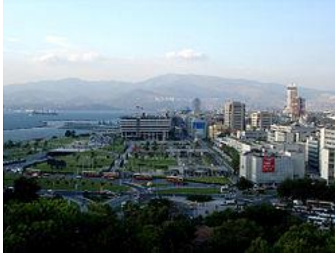
Εικόνα 3. Η Προύσα.

Η Προύσα (1.984.000 κατ.) στους πρόποδες του Ολύμπου, είναι παλιό κέντρο μεταξοβιομηχανίας. Υπήρξε η πρώτη πρωτεύουσα του Οσμανικού κράτους. Τα πολλά τεμένη, οι τάφοι των σουλτάνων και το μαυσωλείο του Σουλτάν Ομάν της δίνουν έντονο μουσουλμανικό χρώμα.