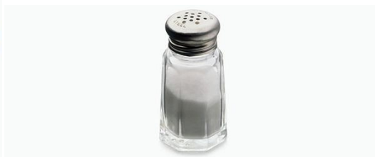
(Το μαγνήσιο και το νάτριο στην διατροφή μας)