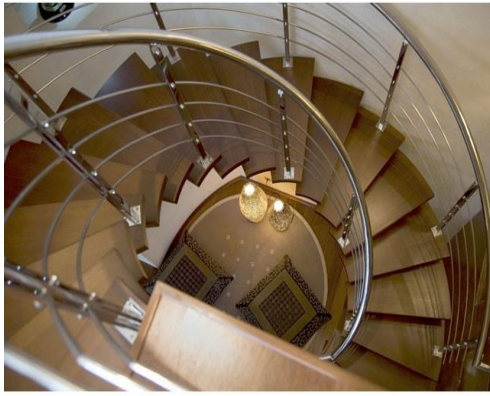
(Μεταλλοκατασκευές από αλουμίνιο)