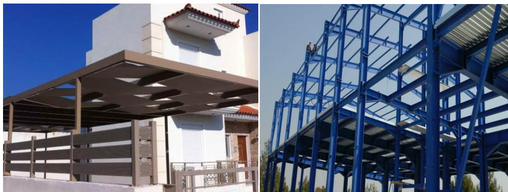
(μεταλλικές κτηριακές κατασκευές)

Οι μεταλλικές κατασκευές είναι κλάδος των κατασκευών που έφτασε στον Ελλαδικό χώρο τα τελευταία χρόνια συγκριτικά με τις κατασκευές από οπλισμένο σκυρόδεμα, οι οποίες γίνονται τις τελευταίες δεκαετίες. Αν και στην Ελληνική πραγματικότητα, τα μεταλλικά κτίρια και οι μεταλλικές κατασκευές δεν έχουν τόσο διαδεδομένη χρήση όσο έχουν στο εξωτερικό, παρατηρείται ωστόσο, ολοένα και περισσότερο, σημαντική άνοδος της χρήσης τους, γεγονός το οποίο οφείλεται στην ανάπτυξη υπολογιστικών μεθόδων που βασίζονται στη βελτίωση της γνώσης της μεταλλικής συμπεριφοράς, των τεχνολογιών κατασκευής, της ύπαρξης κανονισμών για τον υπολογισμό και τον σχεδιασμό αυτών των κατασκευών, αλλά και τα σημαντικά πλεονεκτήματα που παρουσιάζουν έναντι των συμβατικών κατασκευών και των προκατασκευασμένων από άλλα δομικά υλικά.