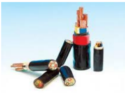
(Μόνωση ηλεκτρικών καλωδίων)

Μόνωση ηλεκτρικών καλωδίων, δίσκοι γραμμοφώνων, κουφώματα.