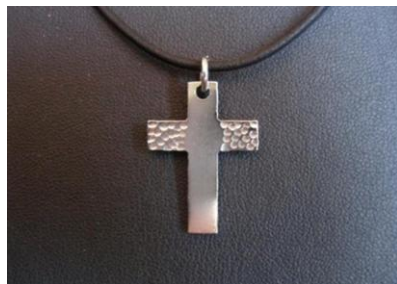
(Κόσμημα από χαλκό)

Πολλά από αυτά μπορούν επίσης να χρησιμοποιηθούν για την παραγωγή κατασκευών όπως ο χρυσός, ο λευκόχρυσος, το ρήνιο, το ταντάλιο, το μαγγάνιο κ.α. Αξίζει να σημειωθεί ότι και το ουράνιο αποτελούσε πρώτη ύλη για κατασκευή διάφορων κατασκευών, αλλά η γνωστοποίηση των βλαβερών επιπτώσεων που φέρει στον οργανισμό του ανθρώπου, το κατέστησαν ακατάλληλο κι έτσι έχει εκμηδενιστεί μέχρι τις μέρες μας η αξιοποίησή του κατ’ αυτόν τον τρόπο. (Μαρία Γαλεράκη, 2013, Ηράκλειο, «ΘΕΡΜΟΜΟΝΩΣΗ ΣΕ ΒΙΟΚΛΙΜΑΤΙΚΑ ΚΤΙΡΙΑ ΜΕ ΤΟΙΧΟΠΟΙΙΑ ΑΠΟ ΜΕΤΑΛΛΙΚΟ ΧΩΡΟΔΙΚΤΥΩΜΑ»).