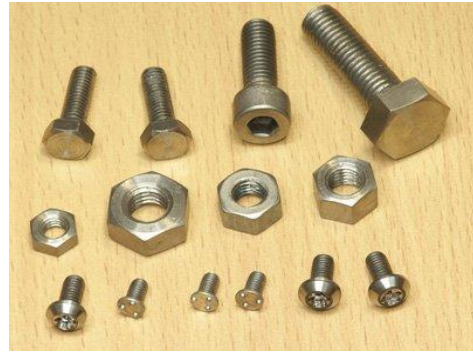
(Εξαρτήματα κι εργαλεία από τιτάνιο)