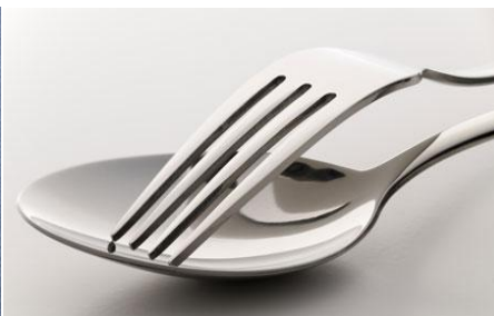
(Οικιακά σκεύη από σίδηρο)