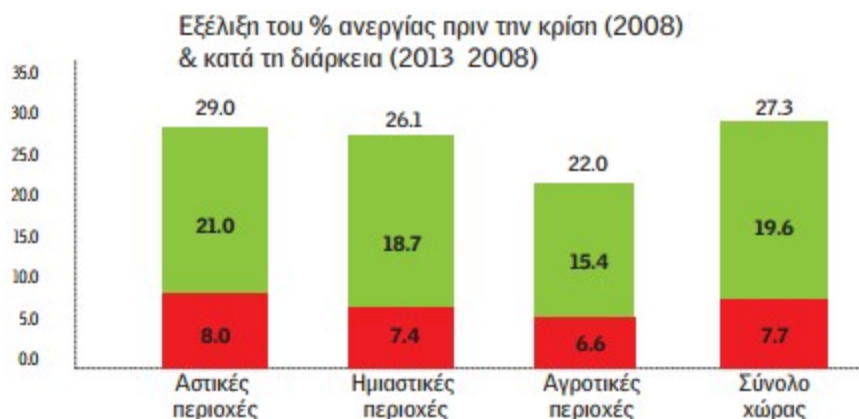
Διάγραμμα 1: Εξέλιξη του Ποσοστού της Ανεργίας πριν και κατά τη διάρκεια της κρίσης