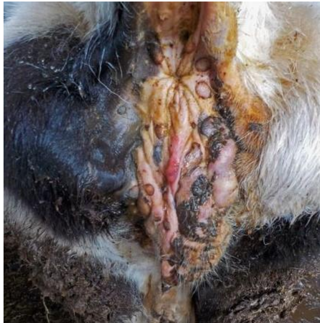
ΕΙΚΟΝΑ 3 : Οζίδια στο απευθυσμένο και στο περίνεο (αιδίο) του ζώου.