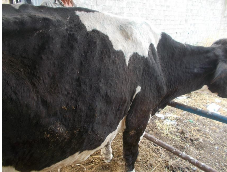
ΕΙΚΟΝΑ 2 : Πολυάριθμα οζίδια σε όλο το σώμα του ζώου.