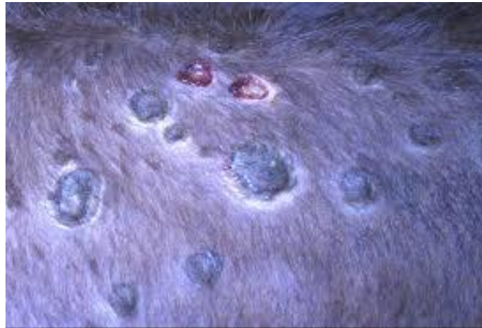
ΕΙΚΟΝΑ 4 : Κλινική εικόνα Οζώδους Δερματίτιδας των Βοοειδών - Δερματικά Έλκη.

Στο Π.Δ. 138/95 (ΦΕΚ 88 Α', 1995) «“Θέσπιση γενικών μέτρων καταπολέμησης ορισμένων ασθενειών των ζώων καθώς και ειδικών μέτρων για τη φυσαλιδώδη νόσο των χοίρων, σε συμμόρφωση προς την Οδηγία 92/119/ΕΟΚ του Συμβουλίου”».