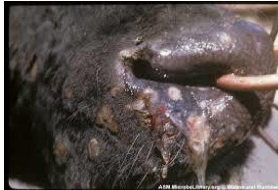
ΕΙΚΟΝΑ 1 : Ρινικό έκκριμα.