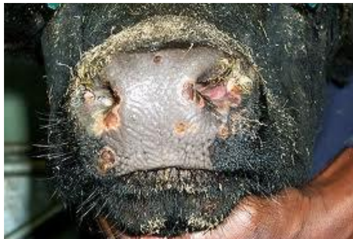
ΕΙΚΟΝΑ 5 : Ρινικές Αλλοιώσεις