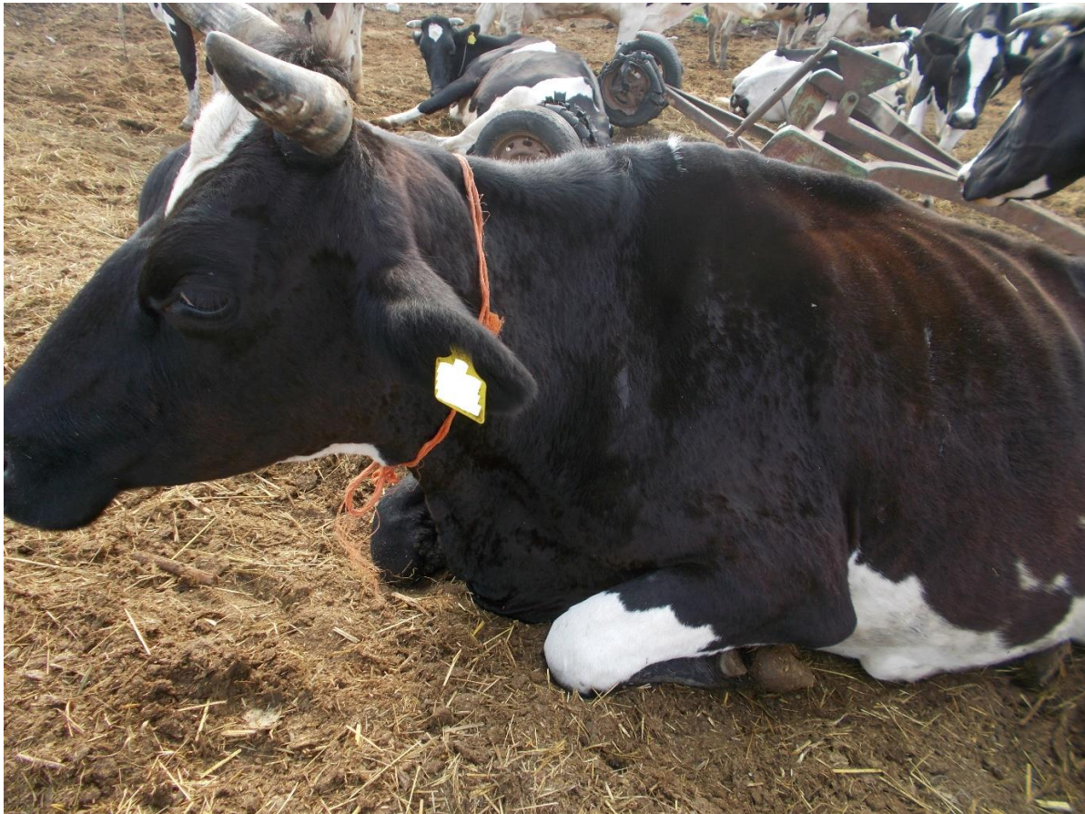
Εικόνα 5. Αγελάδα σε κατάκλιση.