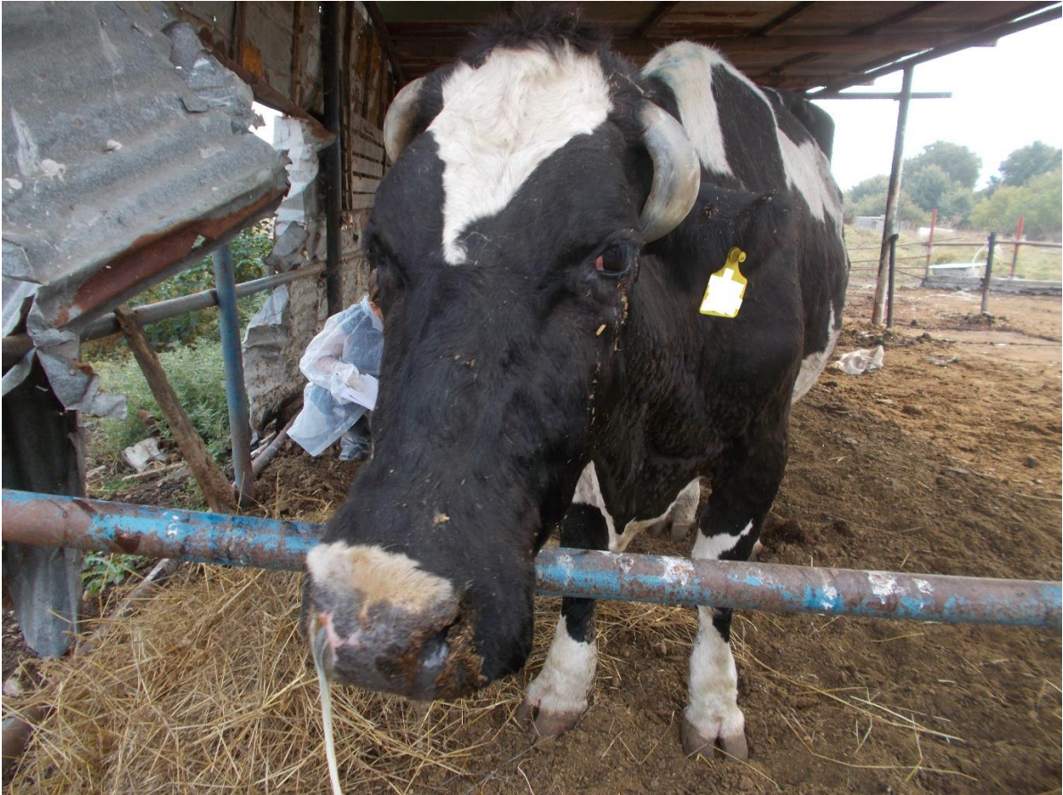
Εικόνα 4. Ρινικό έκκριμα και οφθαλμολογικό.