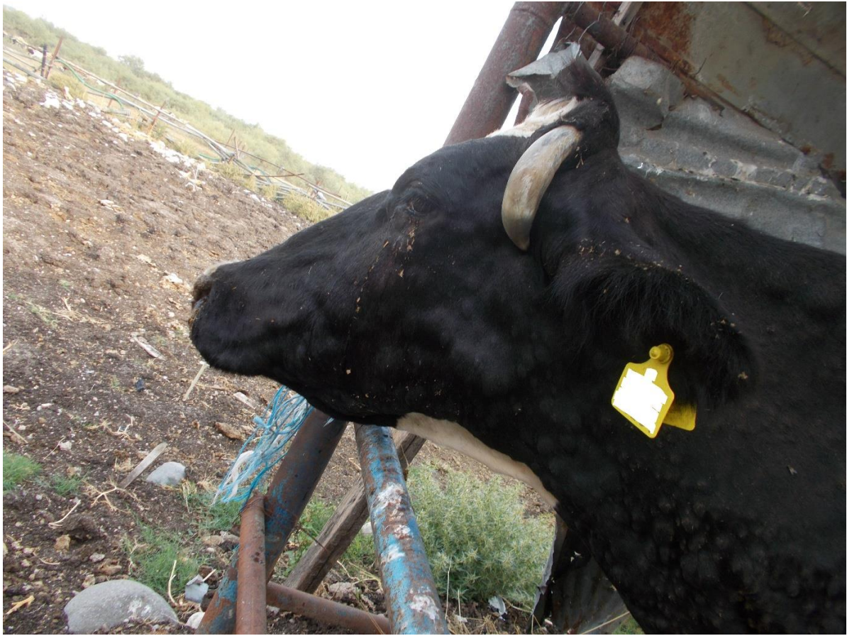
Εικόνα 3. Οζίδια στην τραχηλική χώρα και στην κεφαλή.