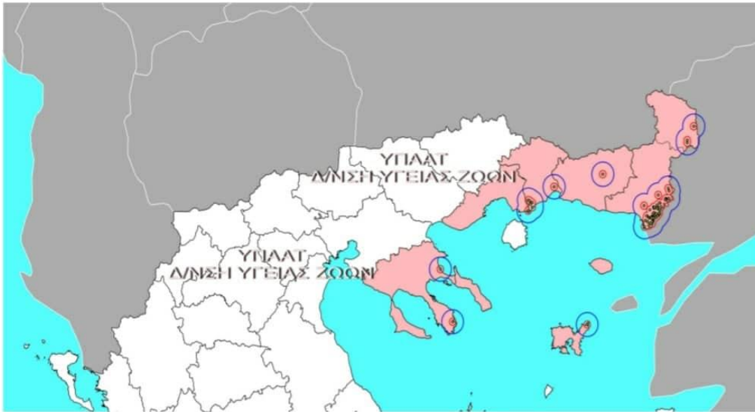
ΕΙΚΟΝΑ 6 : Χάρτης εστιών.

Στις 7 Απριλίου 2016 επιβεβαιώθηκε εστία Οζώδους Δερματίτιδας στην ΠΕ Σερρών στο Δήμο Σιντικής στο Τοπικό Διαμέρισμα Χαρωπού. Έκτοτε έχουν επιβεβαιωθεί επιπλέον 4 εστίες στην ΠΕ Σερρών, όπως αποτυπώνονται στον παρακάτω χάρτη με τις ζώνες των 3 και 25 χλμ.