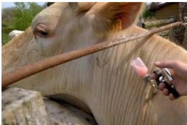
ΕΙΚΟΝΑ 9 : Διαδικασία εμβολιασμού.