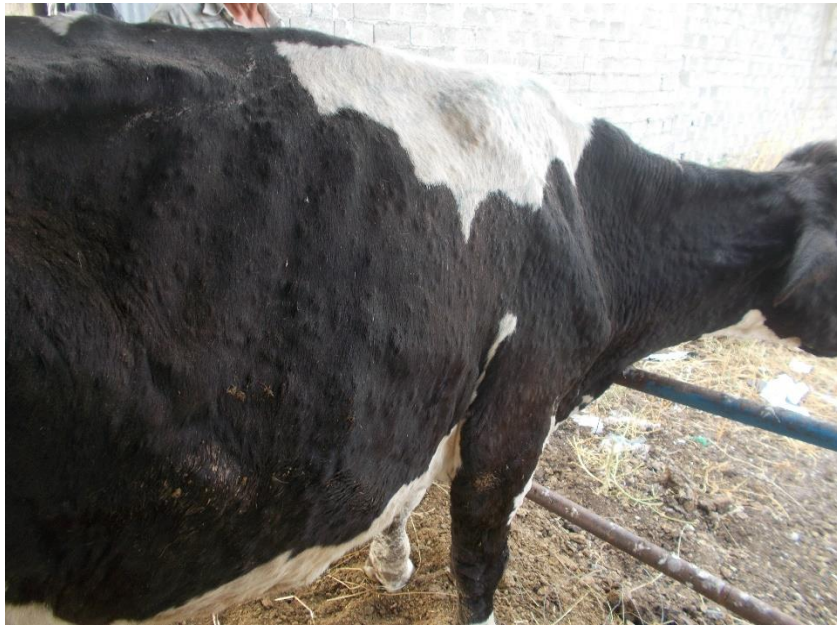
Εικόνα 1. Πολυάριθμα οζίδια σε όλο το σώμα του ζώου.