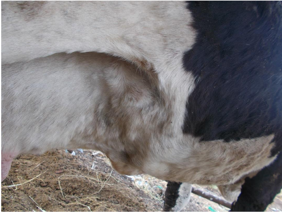
Εικόνα 2. Οζίδια στην επιγονάτια πτυχή.