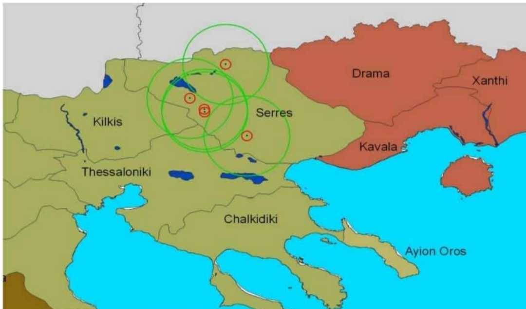
ΕΙΚΟΝΑ 7 : Κρούσματα στις Σέρρες.

Στις 7 Απριλίου 2016 επιβεβαιώθηκε εστία Οζώδους Δερματίτιδας στην ΠΕ Σερρών στο Δήμο Σιντικής στο Τοπικό Διαμέρισμα Χαρωπού. Έκτοτε έχουν επιβεβαιωθεί επιπλέον 4 εστίες στην ΠΕ Σερρών, όπως αποτυπώνονται στον παρακάτω χάρτη με τις ζώνες των 3 και 25 χλμ.