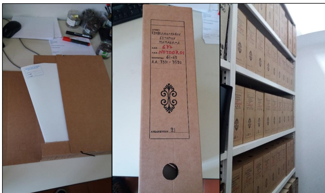
Εικόνα 8: Από αριστερά προς τα δεξιά: άσπροι φακέλοι μέσα σε κυτίο με τη σφραγίδα του IAM να διακρίνεται στην πάνω αριστερή γωνία του φακέλου, η συμπληρωμένη ράχη ενός κυτίου, το ράφι με τα υπόλοιπα κυτία της συλλογής.

Στη συνέχεια οι λευκοί φακέλοι τοποθετούνται σε κυτία, καθένα από τα οποία χωράει τρεις λευκούς φακέλους. Επομένως, στην περίπτωση αυτή, ένα κυτίο αντιστοιχεί σε τρία δελτία ΣΑΕ. Μετά την γόμωση του κυτίου, κλείνει και το κυτίο, και στη ράχη του αναγράφονται τα στοιχεία της συλλογής. Συγκεκριμένα αναγράφεται το πλήρες όνομα της συλλογής, το Α.Β.Ε., το Α.Ε.Ε., οι εμπεριεχόμενες ενότητες (δηλαδή οι άσπροι φακέλοι), και οι ακραίοι αύξοντες αριθμοί των εγγράφων που εμπεριέχονται μέσα στους φακέλους. Εφόσον έχει κλείσει και οι πληροφορίες του έχουν γραφτεί στη ράχη του, το κυτίο είναι έτοιμο για να μπει στο ράφι μαζί με τα υπόλοιπα της συλλογής του. Πέρα από τον καθαρισμό και την ταξινόμηση των εγγράφων, τα έγγραφα μεταφέρονται σε ένα αρχειοστάσιο που σφραγίζει αεροστεγώς, εκτός από τις στιγμές που οι αρχειονόμοι εναποθέτουν ή εξάγουν από αυτό κυτία, καθώς και σε ένα κυτίο το οποίο σαφώς προσφέρει ανώτερη προστασία από τις φυσικές πηγές φθοράς (π.χ. αέρας, ήλιος, υγρασία, ατμοσφαιρική μόλυνση, διακυμάνσεις θερμοκρασίας κτλ) από ότι το προηγούμενο. Αυτές οι ενέργειες διασφαλίζουν την προληπτική, παθητική συντήρηση, η οποία είναι σαφώς ανώτερη από την συντήρηση προς επισκευή φθοράς που έχει ήδη επέλθει.