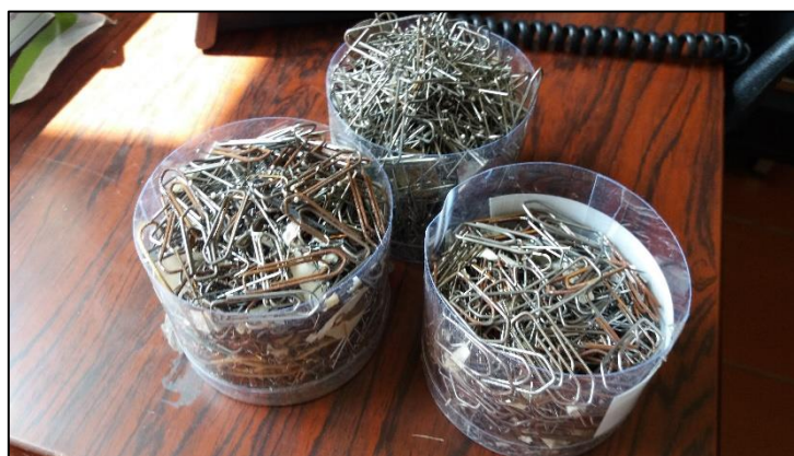
Εικόνα 5: Συνδετήρες, συρραπτικά, παραμάνες και καρφίτσες. Αυτή η ποσότητα συγκεντρωνόταν σε μια μόλις μέρα.

Μετά τον καθαρισμό με τη σβήστρα, σειρά είχε η αντικατάσταση των συνάψεων μεταξύ των εγγράφων. Λυτά έγγραφα τα οποία ήταν συνδεδεμένα πολύ συχνά συσχετιζόνταν το ένα με το άλλο και ως εκ τούτου, προς αποφυγή απώλειας της ορθής θέσης των εγγράφων, ήταν πλήρως αδόκιμη η μη επανασύνδεση τους. Στη θέση των μεταλλικών συνάψεων έμπαιναν συνδετήρες με πλαστική επικάλυψη, έτσι ώστε η σκουριά να μην φτάσει ποτέ στο έγγραφο. Επιπλέον, το πλαστικό τραυματίζει το χαρτί πολύ λιγότερο από ότι το μέταλλο με την πάροδο του χρόνου.