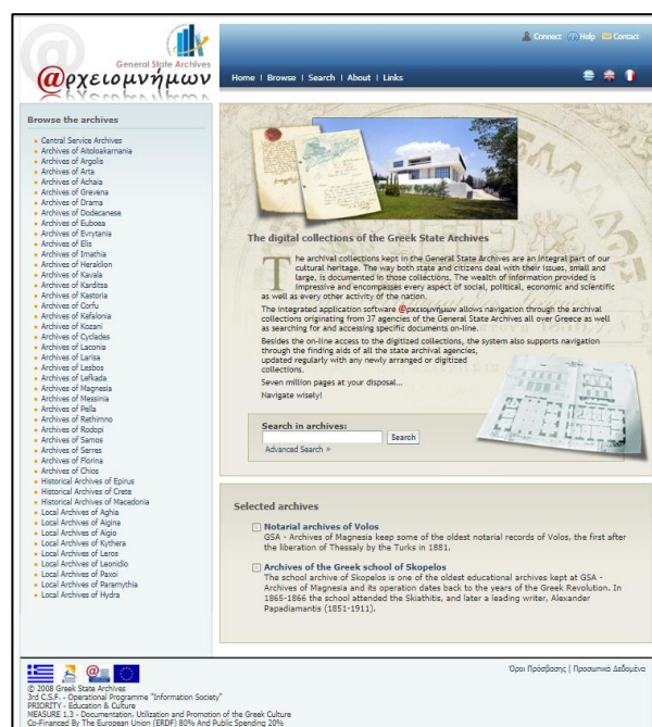
Εικόνα 9: Η αρχική σελίδα του Αρχειομνήμονα

Τέλος, ακολουθεί μια σύντομη παρουσίαση του Αρχειομνήμονα, ως εργαλείο που χρησιμοποιήθηκε κατά τη διάρκεια της εκπόνησης του πρακτικού τμήματος της πτυχιακής εργασίας μου.