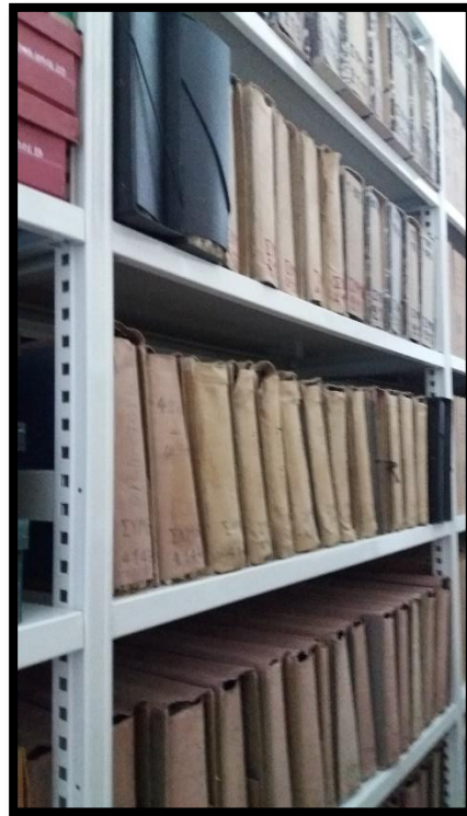
Εικόνα 1: Τα αρχεία στους αρχικούς φακέλους τους, μέσα στα ράφια του συρόμενου αρχειοστασίου.

Κατά την άφιξη μου στο IAM, έπειτα από τη θερμή υποδοχή από την καθηγήτρια μου και το υπόλοιπο προσωπικό της υπηρεσίας, καθώς και μια σύντομη ξενάγηση στο κτίριο, οδηγήθηκα στο υπόγειο, όπου και με περίμενε ο χώρος εργασίας μου, το Ταξινομητήριο. Πρόκειται για ένα δωμάτιο με ένα εντυπωσιακό λευκό αρχειοστάσιο, το οποίο αποτελείται από συρόμενα ράφια, τα οποία επιτρέπουν εύκολη πρόσβαση σε όλο το υλικό, ενώ ταυτόχρονα σφραγίζουν το χώρο αποθήκευσης των αρχείων αεροστεγώς όταν κολλάνε μεταξύ τους. Σε δύο από τα ψηλά συρόμενα ράφια με περίμεναν τα 10.000 συμβόλαια που είχα συμφωνήσει να αναλάβω με την καθηγήτρια μου. Ήταν πακεταρισμένα σε φακέλους ποικίλου μεγέθους και χρώματος, οι οποίοι όμως ήταν εμφανώς παραγεμισμένοι, ταλαιπωρώντας έτσι το ήδη δοκιμασμένο από την πάροδο του χρόνου χαρτί.