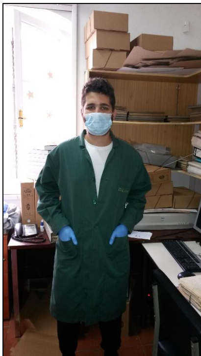
Εικόνα 2: Αρχειονομική αμφίεση

Φυσικά τα μέτρα ασφαλείας που λαμβάναμε δεν είχαν να κάνουν μόνο με την προστασία μας από τους παθογόνους μικροοργανισμούς, αλλά και την προστασία των αρχείων από ανθρώπινο λάθος. Για αυτόν ακριβώς το λόγο απαγορευόταν αυστηρότατα η είσοδος στο Ταξινομητήριο με οποιοδήποτε είδος τροφής ή ποτού, ενώ προφανώς απαγορευόταν το κάπνισμα.