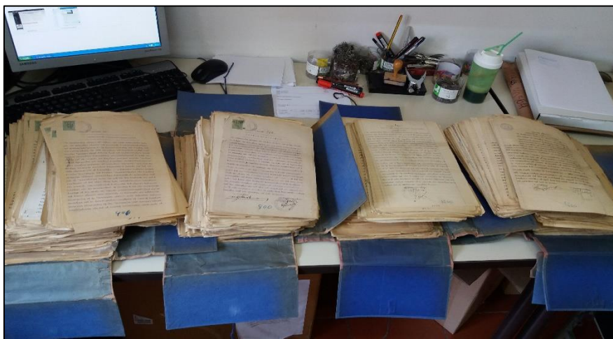
Εικόνα 3: Τα συμβόλαια, όπως φυλάσσονταν μέσα στα αρχικά τους κytia

Τα έγγραφα στη συντριπτική τους πλειοψηφία ήταν λυτά έγγραφα με τη σπάνια συμπερίληψη φακέλων για πιο εκτενείς συμβολαιογραφικές υποθέσεις. Αυτά τα λυτά έγγραφα ομαδοποιούνταν με συνδετήρες, συρραπτικά, κολλητική ταινία τύπου Sellotape, πλαστικά λαστιχάκια και άλλα. Η πρώτη δραστηριότητα της επεξεργασίας ήταν ο καθαρισμός. Έπρεπε τα έγγραφα να απαλλαχθούν από όλα τα μεταλλικά αντικείμενα, καθώς με την πάροδο του χρόνου θα σκούριαζαν, προκαλώντας έτσι φθορά στο ήδη εύθραυστο χαρτί στο οποίο ήταν καταχωρισμένες οι αρχειακές πληροφορίες. Επίσης έπρεπε να αφαιρεθούν τα πλαστικά λαστιχάκια, καθώς και κάθε άλλο αντικείμενο το οποίο ασκούσε πίεση στα έγγραφα που μπορούσε να προκαλέσει φθορά.