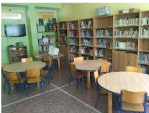
Εικόνα 2: Το εσωτερικό της βιβλιοθήκης