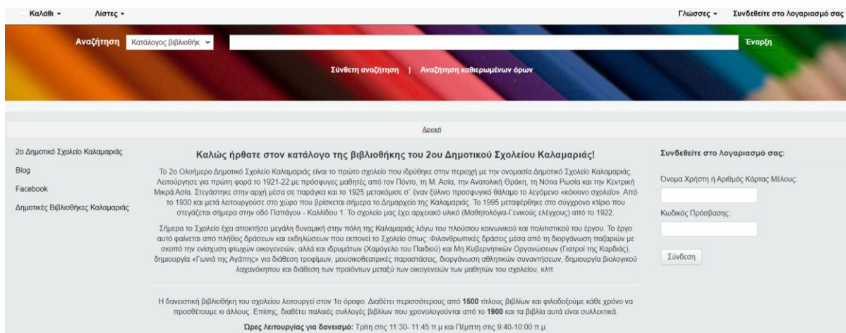
Εικόνα 1: Ηλεκτρονικός κατάλογος: διεπαφή χρήστη

Η Βιβλιοθήκη διαθέτει 2.775 τεκμήρια εκ των οποίων οι 2.699 αντιστοιχούν σε τίτλους βιβλίων και οι 76 σε dvd. Επίσης, διαθέτει αξιόλογες εκδόσεις με βιβλία που χρονολογούνται από το 1900 και τα οποία είναι συλλεκτικά. Η Βιβλιοθήκη χρησιμοποιεί το αυτοματοποιημένο σύστημα βιβλιοθηκών Koha 2 . Η εγκατάσταση έχει γίνει σε server του Πανελληνίου Σχολικού Δικτύου. Στο σύστημα είναι εγγεγραμμένοι και έχουν λογαριασμούς όλοι οι δάσκαλοι και οι μαθητές του Σχολείου. Με αυτό τον τρόπο οι μαθητές μπορούν να κάνουν περιήγηση ποια βιβλία υπάρχουν στον κατάλογο, να κάνουν αναζητήσεις και να αναζητούν πληροφορίες για τα βιβλία της βιβλιοθήκης. Από τα 2.699 βιβλία που υπάρχουν στη συλλογή της Βιβλιοθήκης, τα 403 δεν είχαν εισαχθεί στον ηλεκτρονικό κατάλογο και ως εκ τούτου αποτέλεσαν αντικείμενο της παρούσας πτυχιακής εργασίας.