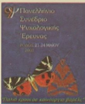
Παλιό κρασί σε καινούργιο βαρέλι