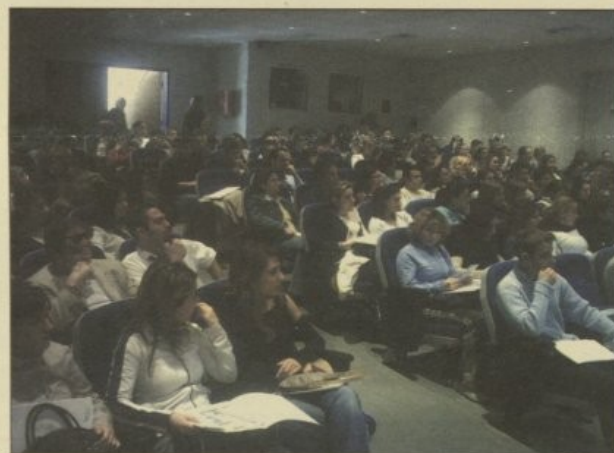
Γενική άποψη της εκδήλωσης στο Αμφιθέατρο Σ.Ε.Υ.Π.

σε συνεργασία με τη Σχολή Επαγγελματιών Υγείας-Πρόνοιας, Τριήμερο επαγ-