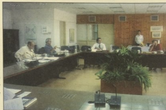
Οι επ. υπεύθυνοι των Γ.Δ., κατά την 1η Ημερίδα που διοργανώθηκε από το Τ.Ε.Ι. Πάτρας για συζήτηση και καταγραφή των προβλημάτων που αντιμετωπίζουν τα Γραφεία.

Τα αποτελέσματα της Ημερίδας, θα αποτελέσουν το επίσημο έγγρα-