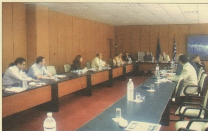
Στημιότυπο από τη συνεδρίαση της Ο.Δ. στην Καλαμάτα.