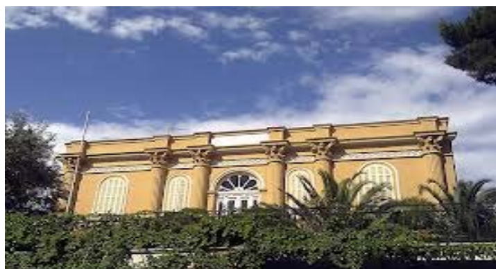
Εικ. 4 Πρόσοψη του κτηρίου από την οδό Παπαναστασίου

Το Ιστορικό Αρχείο Μακεδονίας (Ι.Α.Μ.) είναι μια από τις περιφερειακές υπηρεσίες των Γενικών Αρχείων του Κράτους (Γ.Α.Κ.) και ιδρύθηκε στη Θεσσαλονίκη το 1954 με τον ιδρυτικό νόμο 2869/1954 (Υπουργείο Παιδείας και Θρησκευμάτων, 2014).