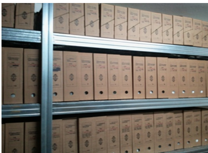
Εικ. 9 Τελική ταξινότηση στο αρχειοστάσιο

Τέλος, αξίζει να αναφερθεί μαζί με τα υπόλοιπα εργαλεία που χρησιμοποιήθηκαν για την δημιουργία της εργασίας και αναφέρθηκαν ήδη, η χρήση του Microsoft Word για την συγγραφή της εργασίας, το πρότυπο APA για τις παραπομπές και την βιβλιογραφία και το πρότυπο του Ε.Λ.Ο.Τ. (Ελληνικός Οργανισμός Τυποποίησης) για τις συντομογραφίες.