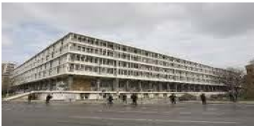
Εικ. 6 Δικαστικό Μέγαρο Θεσσαλονίκης