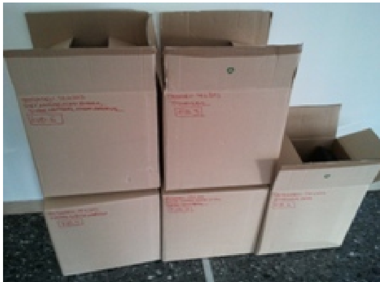
Εικ. 10 Μέρος του αρχειακού υλικού στα κιβώτια παραλαβής