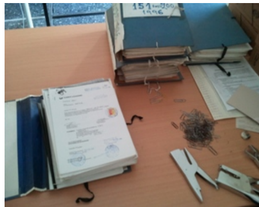
Εικ. 8 Επεξεργασία υλικού

Κατά την παράδοση του αρχείου η αρχειακή υπηρεσία που παραλαμβάνει το υλικό από τη δημιουργό υπηρεσία συντάσσει το πρωτόκολλο παράδοσης – παραλαβής που συνοδεύεται από αναλυτική κατάσταση του υλικού σε δύο αντίγραφα ένα για την κάθε υπηρεσία. Το αρχείο στη συνέχεια καταγράφεται στο γενικό βιβλίο εισαγωγής εγγράφων και παίρνει έναν αύξοντα αριθμό Α.Β.Ε.(Αριθμός Βιβλίου Εισαγωγής) καθώς και ένα δεύτερο αριθμό Α.Ε.Ε.(Αριθμός Ειδικού Ευρετηρίου) που είναι ο ενδεικτικός αριθμός της κατηγορίας στην οποία ανήκει το αρχείο. Αυτές οι ενδείξεις εισαγωγής θα το συνοδεύουν στο εξής στην υπηρεσία των Γ.Α.Κ. από την προσωρινή του αποθήκευση μέχρι την τελική του επεξεργασία, που ολοκληρώνεται με την αρχειοθέτηση, ταξινόμηση και ταξιθέτηση του σε αρχειοστάσιο.