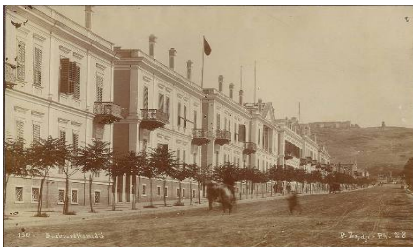
Εικ. 5 Παλιά δικαστήρια στη λεωφόρο Χαμιδιέ (Εθνικής Αμύνης)

Γρήγορα όμως προέκυψε η ανάγκη ανέγερσης νέου σύγχρονου δικαστικού μεγάρου καθώς διαπιστώνονταν ότι το κτίριο αυτό δεν επαρκούσε για την ικανοποίηση των ολοένα αυξανόμενων αναγκών. Στις 6 Φεβρουαρίου 1978 εγκαινιάζεται το νέο Δικαστικό Μέγαρο Θεσσαλονίκης όπου στεγάζεται το Πρωτοδικείο μέχρι σήμερα. Λίγο αργότερα το παλιό κτίριο μετά το μεγάλο σεισμό εκείνης της χρονιάς κρίνεται κατεδαφιστέο και ισοπεδώνεται.