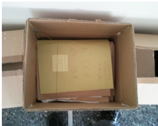
Εικ. 7 Αρχική παραλαβή

Η όλη διαδικασία της εργασίας του αρχειονόμου ξεκινά με την παραλαβή του αρχείου. Σύμφωνα με τον ισχύοντα νόμο (Ν. 1946/1991 κεφ.2 αρ.41) που ορίζει ότι όλες οι δημόσιες υπηρεσίες κάθε ένα ή δυο χρόνια οφείλουν να διαχωρίζουν, να καταγράφουν το υλικό που δεν έχει πλέον υπηρεσιακή χρησιμότητα και να το κοινοποιούν στα Γ.Α.Κ.