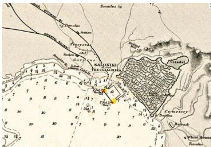
Η Θεσσαλονίκη σε χάρτη του Βρετανικού Ναυαρχίου.

Μια χαρτογραφική περιήγηση στην ιστορία της πόλης