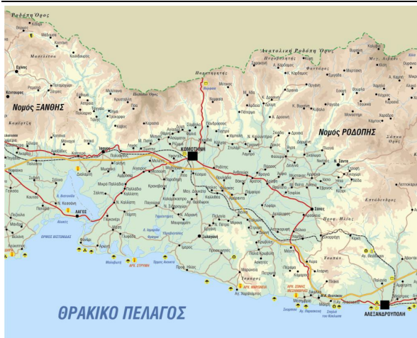
Χάρτης Νομού Ροδόπης