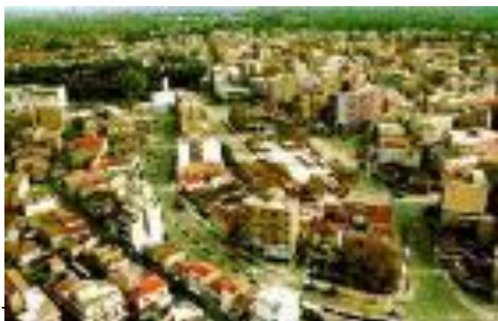
Πανοραμική Άποψη Κομοτηνής

Η Κομοτηνή , με πληθυσμό 43.326 κατοίκους, είναι η πρωτεύουσα του νομού και η έδρα της διοικητικής Περιφέρειας Ανατολικής Μακεδονίας και Θράκης. Είναι ένα σύγχρονο οικονομικό και διοικητικό κέντρο, μια πόλη που καταφέρνει να συνδυάζει τα ιστορικά της