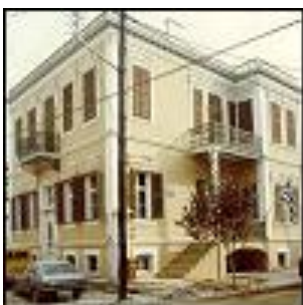
Δημοτική Βιβλιοθήκη Κομοτηνής

Διώροφο με ευρύχωρες αίθουσες όπου φυλάσσονται 14.000 βιβλία, ταξινομημένα σε κατηγορίες και είδη, και με μεγάλη αίθουσα αναγνωστηρίου. Αγοράστηκε από τον Δήμο και αναπαλαιώθηκε. Από τα βιβλία ξεχωρίζουν εκείνα που αφορούν στην Ιστορία και στον Πολιτισμό της Θράκης και αποτελούν για όλους τους κατοίκους και πιο πολύ για τους νέους και τις νέες, σημαντική πηγή γνώσης και πληροφοριών. Εκτός από τα βιβλία που αφορούν στην Θράκη, υπάρχουν και τόμοι ποικίλης επιστημονικής γνώσης, καθώς και συγγράμματα Φιλοσοφικά, Κοινωνιολογικά, Λαογραφικά και τόμοι βιβλίων Ελληνικής και Ξένης Λογοτεχνίας. Ο Δήμος Κομοτηνής σε συνεργασία με την Τοπική Ένωση Δήμων και Κοινοτήτων Νομού Ροδόπης, λειτουργεί και κινητή βιβλιοθήκη, σε ειδικά διασκευασμένο αυτοκίνητο, που σε τακτά χρονικά διαστήματα επισκέπτεται Κοινότητες και χωριά και εξυπηρετεί τις αναγνωστικές ανάγκες των κατοίκων, ιδίως των νέων σχολικής ηλικίας. Λειτουργεί καθημερινά: 7:00 - 14:00 και 17:00 - 20:00 εκτός Τετάρτης. Κατά τους καλοκαιρινούς μήνες λειτουργεί μόνο πρωί 7:00 - 14:00.