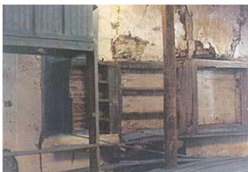
Εμπορικό Κέντρο Ξυλαγανής(εσωτερικό). Είσοδος στο μαγειρείο. Φαίνεται και ο φούρνος. Η φωτογραφία πάρθηκε λίγες μέρες πριν την κατεδάφισή του.

Το εμπορικό κέντρο της Ξυλαγανής κτίστηκε στη σημερινή οδό Αναλήψεως από τον Αναστάσιο Πολιτσάκη ο οποίος είχε έρθει από την Αμερική με πολλά χρήματα. Το 1926 άρχισε το κτίσιμο που το 1928 είχε πια ολοκληρωθεί. Αποτελούνταν από συνεχόμενα καταστήματα τα οποία σώζονταν εγκαταλειμμένα μέχρι το 1994. Σήμερα δεν υπάρχει πια.