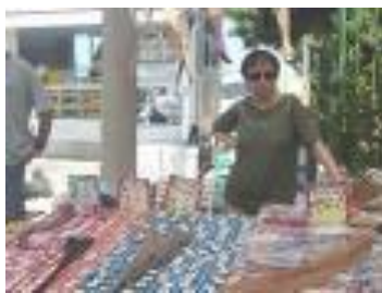
Μικροπωλητής στο Παζάρι της Κομοτηνής

Το παζάρι αρχικά λειτουργούσε την ημέρα Κυριακή. Το 1864, ο Μητροπολίτης Θεόκλητος μετέφερε την Τρίτη για να μην παραμελούν οι κάτοικοι τα θρησκευτικά τους καθήκοντα. Τώρα πλέον λειτουργεί το Σάββατο. Είναι ένα ιδιαίτερο σημαντικό κοινωνικό γεγονός. Πραγματευτάδες απλώνουν τιςπραμάτειες τους, όλα τα είδη που μπορεί κανείς να φανταστεί. Από φρέσκα φρούτα και λαχανικά μέχρι ζωντανά πουλερικά , εσώρουχα, κομπολόγια και χαλιά.