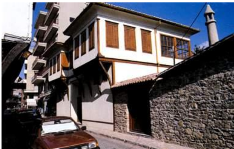
Λαογραφικό Μουσείο Κομοτηνής

Το Λαογραφικό Μουσείο, που ανήκει στο Μορφωτικό Όμιλο Κομοτηνής, στεγάζεται από το 1989 στο αναπαλαιωμένο αρχοντικό Πεϊδη. Στεγάζει μια μακρόχρονη ιστορία που χάνεται στους αιώνες. Τα πλούσια εκθέματα του - φορεσιές, γεωργικά εργαλεία και σύνεργα, είδη οικιακής χρήσης, σπάνια βιβλία, εικόνες και φωτογραφίες - δίνουν την εικόνα της παραδοσιακής ελληνικής Θράκης. Αξιόλογη είναι η συλλογή και τα προσωπικά κειμήλια του αρχιεπισκόπου Αθηνών, του Χρύσανθου Φιλιππίδη (1882-1949), που γεννήθηκε στη Γρατινή Κομοτηνής και έγινε ο άγιος και σωτήρας της Τραπεζούντας. Έξοχη είναι η μεγάλων διαστάσεων εικόνα του 18 ου αιώνα με απεικόνιση του Χριστού, της Παναγίας, της Αγίας Άννας και των προφητών.