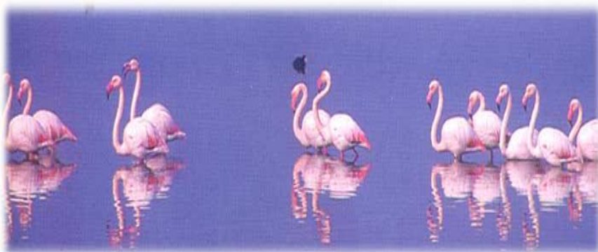
Φλαμίγκος στη Λίμνη Βιστωνίδα

Η λίμνη Βιστωνίδα βρίσκεται στη δυτική πρόσβαση του νομού, από την παλιά εθνική οδό, μεταξύ των νομών Ξάνθης και Ροδόπης και αποτελεί προέκταση του μυχού του Πόρτο Λαγούς.