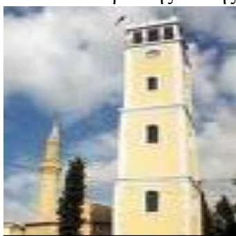
Το ρολόι της Κομοτηνής

Στο κέντρο της πόλης δεσπόζει ο Πύργος του Ωρολογίου που χτίστηκε στα 1884, την εποχή του Σουλτάνου Αμπντούλ Χαμίτ. Στην δεκαετία του 1950 έγιναν αρχιτεκτονικές επεμβάσεις και πήρε την σημερινή του μορφή. Πίσω από τον πύργο υψώνεται ο μιναρές του τεμένους Γενί Τζαμί, από τον εξώστη του οποίου ο μουεζίνης καλεί τους πιστούς του Ισλάμ στην προσευχή. Στο προαύλιό του στεγάζεται η θρησκευτική αρχή των μουσουλμάνων της Ροδόπης, η Μουφτεία Κομοτηνής. Το εσωτερικό του Γενί Τζαμί είναι ανοιχτό για τους επισκέπτες, αρκεί να τηρήσουν ορισμένους τυπικούς κανόνες, όπως το βγάλσιμο των παπουτσιών κ.α. Στην ΝΔ πλευρά του συγκροτήματος πύργου-τεμένους βρίσκεται η πεζοδρομημένη εμπορική οδός Ερμού, ενώ στην ΒΑ πλευρά, στην παραδοσιακή πλατεία του Ηφαιστού, είναι συνωστισμένα τα εργαστήρια του λευκοσιδήρου, τα γνωστά τενεκετζίδικα, που δίνουν ένα μοναδικό χρώμα στην αγορά της πόλης που απλώνεται τριγύρω.