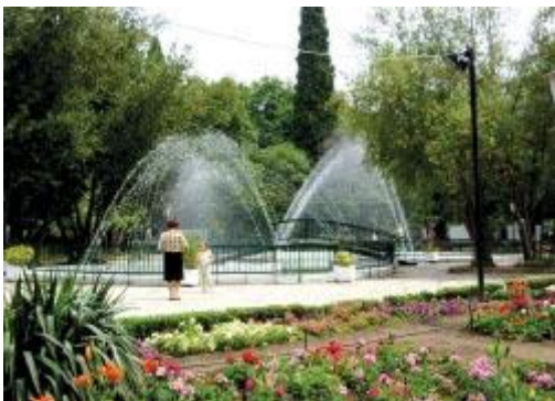
Δημοτικός Κήπος Κομοτηνής

Παρόλο που η πόλη της Κομοτηνής είναι καταπράσινη, ο Δημοτικός Κήπος (Πάρκο) είναι ο πνεύμονας και το στολίδι της πόλης. Βρίσκεται πίσω από το κεντρικό ηρώο της πόλης, δίπλα στην κεντρική πλατεία και καλύπτει έκταση 21 στρεμμάτων.