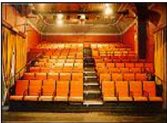
Αίθουσα ΔΗ.ΠΕ.ΘΕ. Κομοτηνής

Φορέα τέχνης και πολιτισμού αποτελεί το Δημοτικό Περιφερειακό Θέατρο Κομοτηνής που ιδρύθηκε το 1984. Μέχρι σήμερα έχει παρουσιάσει πολλά έργα ποιότητας, Ελλήνων και ξένων συγγραφέων, και δικαίως θεωρείται ένα από τα σημαντικότερα επαρχιακά θέατρα. Παραστάσεις δίνονται όλο το χρόνο, είτε στο χειμερινό χώρο, είτε στο Υπαίθριο Δημοτικό Θέατρο, χωρητικότητας 900 περίπου θέσεων, που βρίσκεται δίπλα στο Αρχαιολογικό Μουσείο. Στις ιστοσελίδες του ΔΗ.ΠΕ.ΘΕ βρίσκετε πλήθος πληροφοριών σχετικά με την ιστορία του Θεάτρου, τις παραστάσεις που δίνονται, εκτενείς αναφορές σε θεατρικά θέματα και πολλά άλλα.