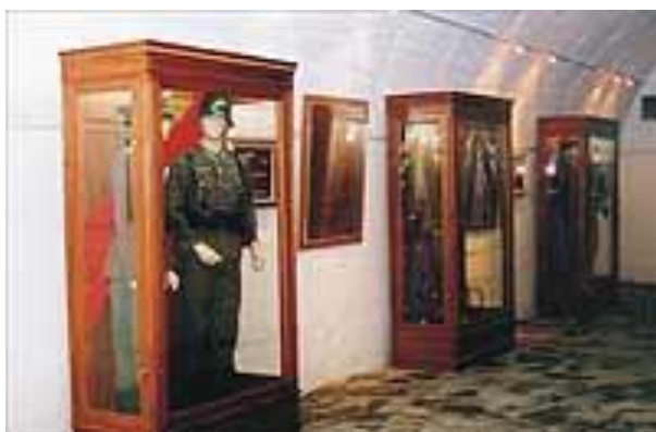
Εσωτερική Άποψη Στρατιωτικό Μουσείο Οχυρού Νυμφαίας

Το Στρατιωτικό Μουσείο του Οχυρού Νυμφαίας βρίσκεται 17 χλμ από την Κομοτηνή και λειτουργεί από το 2000 εντός στοάς του ομώνυμου Οχυρού.