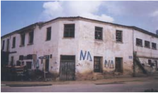
Λαογραφικό Μουσείο Ξυλαγανής

Οι γυναίκες συζητούσαν με τις φίλες τους στην αυλή και τα παιδάκια, πηγαίνοντας στο σχολείο, ζέσταιναν τα χεράκια τους στο μεγάλο μπουρί του ή έπαιζαν με τα διάφορα εξαρτήματα του.