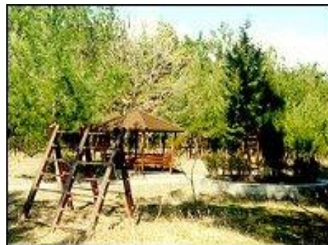
Περιστικό Δάσος Νυμφαίας

Είναι δύσκολο για τον επισκέπτη ν'αντισταθεί στον πειρασμό να μην επισκεφτεί, την πραγματικά μαγευτική τοποθεσία της Νυμφαίας, πάνω από την βορινή πλευρά της Κομοτηνής σε απόσταση 4 χλμ. Το χώρο όπου έζησαν οι Νύμφες, θεότητες που εμπνέουν στους ανθρώπους το προφητικό παραλήρημα, που πλανεύουν το νου και μοιάζουν με τις γόησες και τις νεράιδες του Μεσαίωνα. Εκεί βρίσκεται το αισθητικό