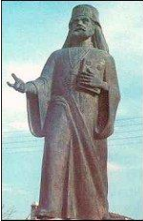
Μητροπολίτης Μαρωνείας Κωνσταντίνος

5.1.1 Ελευθέριου Βενιζέλου: Ο ανδριάντας είναι τοποθετημένος στον χώρο απέναντι από το μέγαρο του Υποκαταστήματος του Ιδρύματος Κοινωνικών Ασφαλίσεων (ΙΚΑ), στην συμβολή των οδών Υψηλαντών, Δημοκρίτου, Μ. Μπότσαρη και Αλέξανδρου Συμεωνίδη. Τα αποκαλυπτήριά του έγιναν στην διάρκεια του εορτασμού των "Ελευθερίων" της πόλης στα 1990. Έργο του γλύπτη Νικόλα. Με την ανέγερσή του οι Κομοτηναίοι τίμησαν τον ηγέτη, που ως πρωθυπουργός επέτυχε τον διπλασιασμό της ελληνικής επικράτειας και υπήρξε το ίνδαλμα των Βορειοελλαδιτών και όλων των προσφύγων.