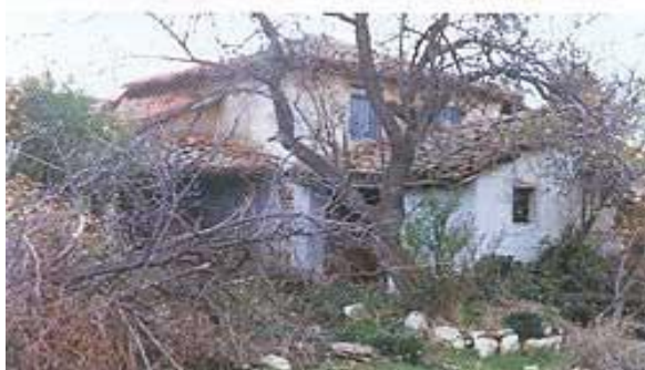
Οικία Γιαμούκη. Κτίστηκε γύρω στα 1844

οποία έβαζαν λάσπη και τα ξέραιναν στον ήλιο. Το χτίσιμο ακολουθούσε το ασβέστωμα της κάθε κατασκευής. Στο χωριό υπήρχαν μόνο τέσσερα διώροφα. Στο ένα από αυτά που βρίσκεται απέναντι από την εκκλησία, έμενε ο παπάς. Το ισόγειο του λειτουργούσε στην εποχή των Βουλγάρων ως σχολείο.