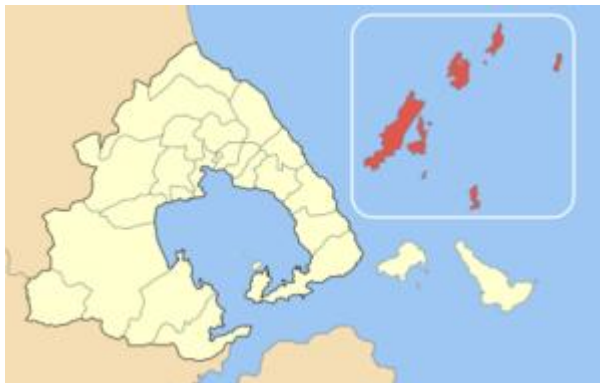
Ο δήμος Αλοννήσου