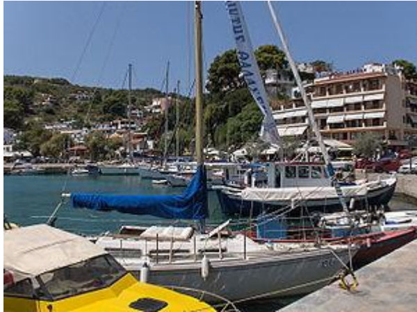
Το λιμάνι της Αλοννήσου