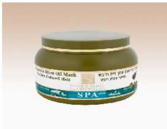
29 μ μ μ

μ μ μ μ , μ , , μ μ . μ , , μ . μ μ μ μ μ μ μ μ 5 μ μ μ μ μ μ μ μ μ μ , μ , , μ , styling, μ μ , μ . ..