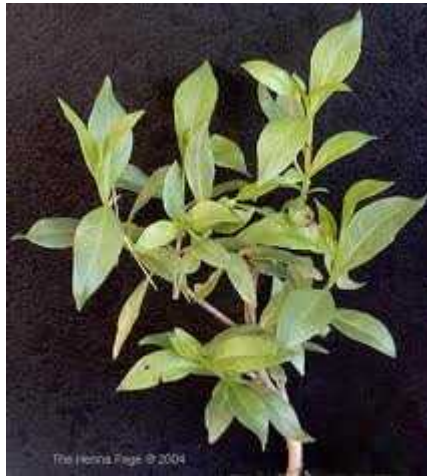
60 Lawsonia Inermis.

μ μ μ , μ . μ , μ μ . μ μ μ μ μ μ μ , μ . henna μ μ . henna μ O μ μ μ μ ( , 2008).