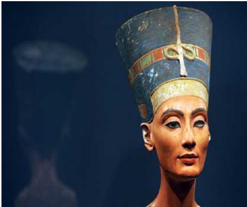
44 μ μ

, μ . , μ , μ ( , 2005). μμ μ μμ . , μ μ , μμ μ μ μ , μμ μ . μμ μ μμ μ . μμ μ μ μ μ . μ , μ , μ , μ , μ . μ μ μ μ μ μ , μ μ .