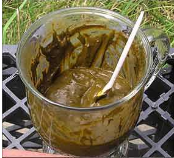
62 μ henna

μ . μ , μ μ . henna μ μ μ ( : http://www.livit.gr/article.php?articleId=2539 ).