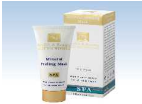
28 Peeling Mask μ