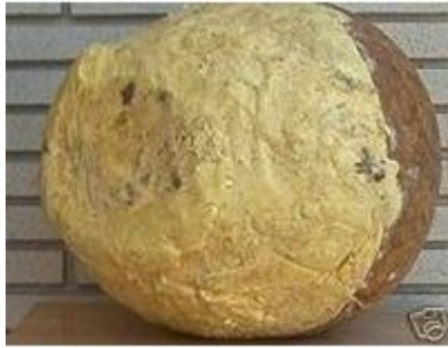
Εικόνα 1. Νωπό και ακατέργαστο βούτυρο shea