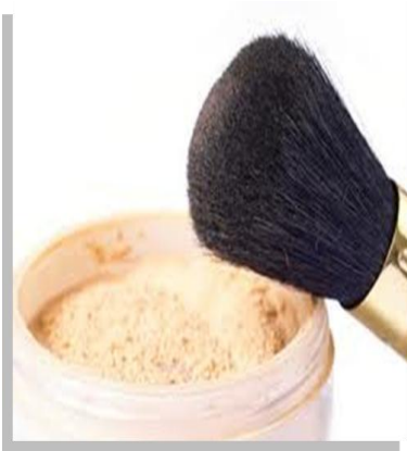
Πούδρα σε σκόνη