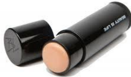
make up σε στίκ μορφή