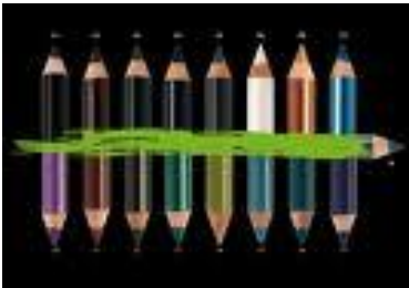
Μολύβι για τα μάτια