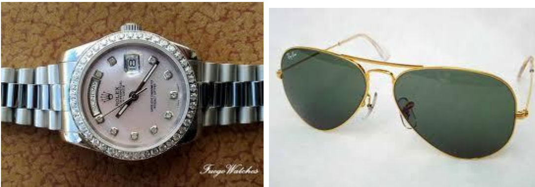
Ρολόι δεκαετίας '80