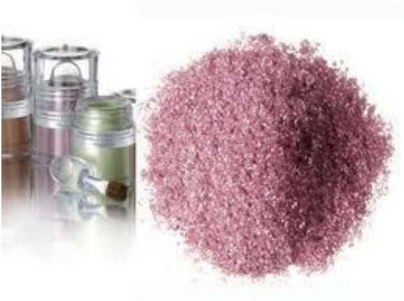
Σκιά σε σκόνη