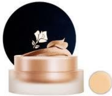
Κρεμώδη make up