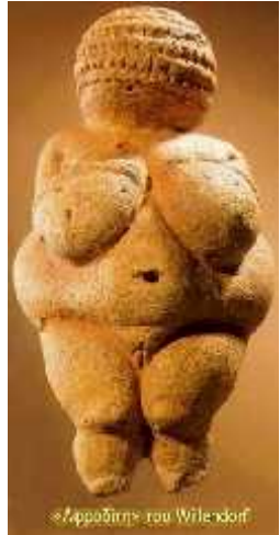
«Золотница» из Виландорфа

10. Вопросы и задания к 10 уроку. 1. Как вы думаете, что такое искусство? Почему искусство так важно для человека? Приведите примеры искусства, которые вы знаете. 2. Почему искусство помогает нам лучше понять себя и мир вокруг нас? Приведите примеры искусства, которые вас вдохновляют. 3. Как искусство может изменить мир? Приведите примеры искусства, которые изменили мир. 4. Почему искусство так важно для культуры? Приведите примеры искусства, которые являются частью культуры.