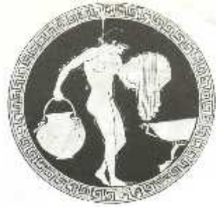
μ (480 . .)

. , μ . μ , μ , . μ μ μ . μ μ μ . « μ » , μ . μ μ μ , μ . μ μ μ , ( μ ) ( μ ) , μ . μ μ , μ μ , μ μ μ μ μ μ μ μ : μ « μ » . μ μ μ