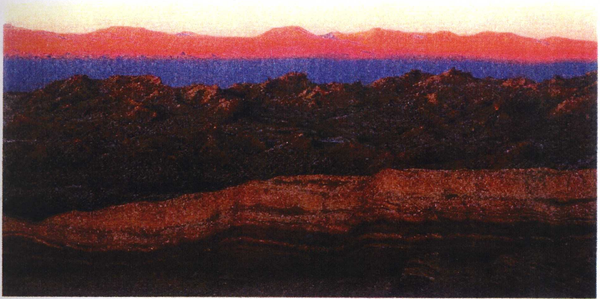
Η νύχτα γεμίζει την άνοδρη Μπάγι ντε λα Λοίνα (Κοιλιά του Φεγγαριού) ενώ οι τελευταίες ακτίνες φωτίζουν τις κορυφές των Άνδεων Δυτικά από το Σαν Πέδρο ντε Ατακάμα (Χιλή). φωτογράφος Woods Wheatcroft αριθμός 151

Το πώς ο άνθρωπος από την ημέρα της ύπαρξής του μέχρι τις μέρες μας αντιλαμβανόταν την ομορφιά και την αναδεικνυε με διάφορους τρόπους είναι ένα θέμα το οποίο δεν έχει ερευνηθεί αρκετά γι' αυτό και προκαλεί μεγάλη πρόκληση στο να ασχοληθεί κάποιος και να το μελετήσει.