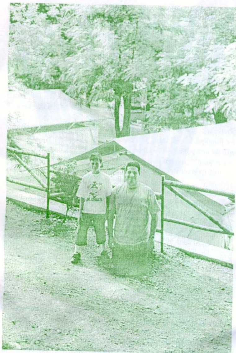
Ο ομαδάρχης για να φτάσει στο ύψος του παιδιού πρέπει να γονατίσει....

Φροντίζει από την πρώτη μέρα για την διακόσμηση της σκηνής και του εξωτερικού χώρου, την «κραυγή» της ομάδας του μαζί με τα παιδιά, το έμβλημα της ομάδας τους, το τραγούδι τους. Ποτέ δεν ησυχάζει και νομίζει ότι όλα πάνε καλά. Συμπληρώνει καθημερινή έντυπη αναφορά και το ειδικό δελτίο για τα πεπραγμένα που την καταθέτει στους ανωτέρους. Άδεια απουσίας παίρνει μετά από συνεννόηση με τον αρχηγό 2 μέρες πριν, για ένα το πολύ εικοσιτετράωρο και αντικαθίσταται από άλλον. Στην έπαρση και την υποστολή η προσέλευση ομαδαρχών και κατασκηνωτών γίνεται με τάξη και οι ομαδάρχες παρατάσσονται αριστερά.