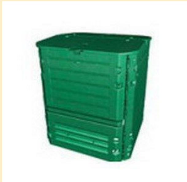
ΚΑΔΟΣ ΚΗΠΟΥ 600 ΛΙΤΡΩΝ