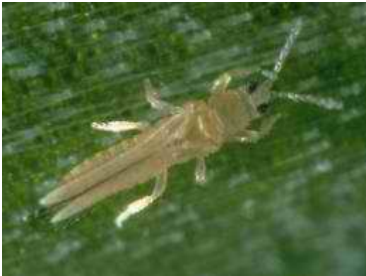
Εικόνα 25 : Θρίπας

Περισσότερο υποφέρουν οι πρώιμες φυτείες, ιδιαίτερα όταν λόγω του καιρού δεν ευνοείται η γρήγορη ανάπτυξη των φυτών.