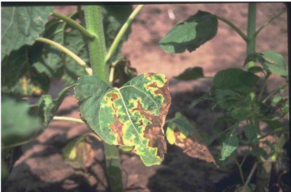
Εικόνα 30 : Αδρομύκωση

Ο μύκητας βρίσκεται στο έδαφος και η μόλυνση των βαμβακόφυτων γίνεται από το ριζικό σύστημα. Στα φυτά που προσβάλλονται πρώιμα προκαλείτε νέκρωση, ενώ στις όψιμες προσβολές αποφύλλωση και πρώτο άνοιγμα των καρυδιών.