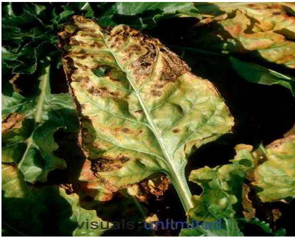
Εικόνα 32 : Αλτερνάρια

Προσβάλλει τα φύλλα και τα καρύδια του βαμβακιού, στα φύλλα, στη αρχή, δημιουργούνται κηλίδες στρόγγυλες οι οποίες αργότερα μεγαλώνουν ομόκεντρα και ξηραίνονται. Αποτέλεσμα της προσβολής αυτής είναι η αποφύλλωση και το πέσιμο των καρυδιών. Ευνοϊκοί παράγοντες για την ανάπτυξη της ασθένειας είναι οι χαμηλές θερμοκρασίες, τα μη κανονικά ποτίσματα και υπερβολική λίπανση φωσφόρου. Τα αδύνατα φυτά μπορούν να πάθουν μεγάλη ζημιά, ενώ το αντίθετο συμβαίνει στα φυτά με ικανοποιητική ανάπτυξη.