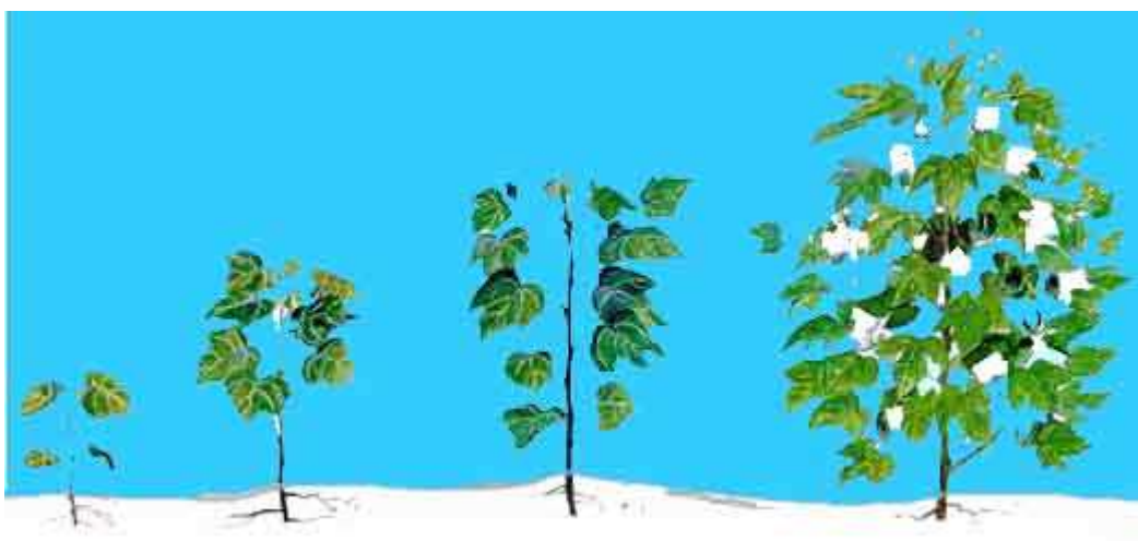
Εικόνα 2 : Στάδια ανάπτυξης Βαμβακόφυτου

Η πορεία ανάπτυξης του φυτού του βαμβακιού για πρακτικούς λόγους μπορεί να διακριθεί σε πέντε βασικά στάδια ανάπτυξης : 1) φύτευμα – εμφάνιση κοτυληδόνων , 2) πρώτη ανάπτυξη – διαμόρφωση της φυτοστοιβάδας , 3) σχηματισμός ανθοφόρων οφθαλμών – έναρξη άνθησης , 4) άνθηση – έναρξη καρποφορίας , 5) ανάπτυξη και ωρίμανση καρπών (καρυδιών). Το βαμβάκι είναι φυτό συνεχούς ανάπτυξης (η βλαστική αύξηση συνεχίζεται ενώ εμφανίζονται άνθη και καρποί) οπότε μεταξύ των σταδίων 3,4 και 5 παρουσιάζονται αλληλοεπικαλύψεις . Η εμφάνιση της καλλιέργειας του βαμβακιού σε διάφορα στάδια ανάπτυξης παρουσιάζεται στην Εικόνα 2.