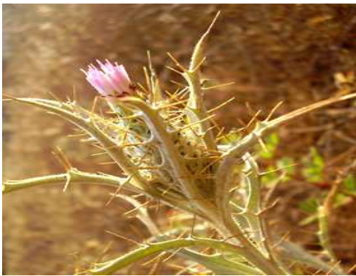
Εικόνα 13 : Ασπράγκαθο