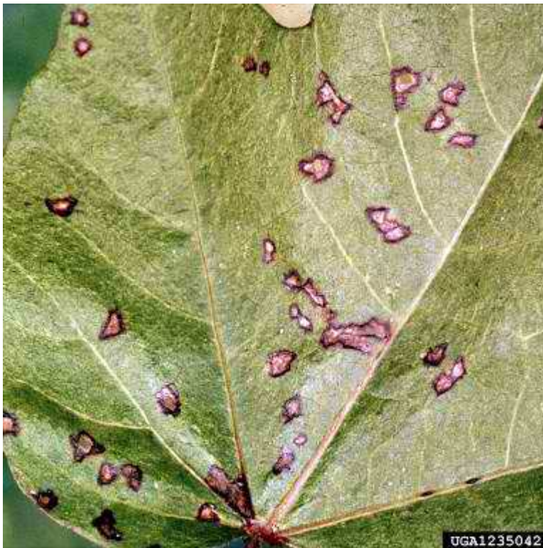
Εικόνα 33 : Βακτηρίωση

Στα φύλλα σχηματίζονται κηλίδες γωνιώδεις, σκουροπράσινες έως καστανόμαυρες που αργότερα γίνονται νεκρωτικές. Στα στελέχη οι κηλίδες είναι επιμήκεις σκουροπράσινες και στα καρύδια μαύρες.