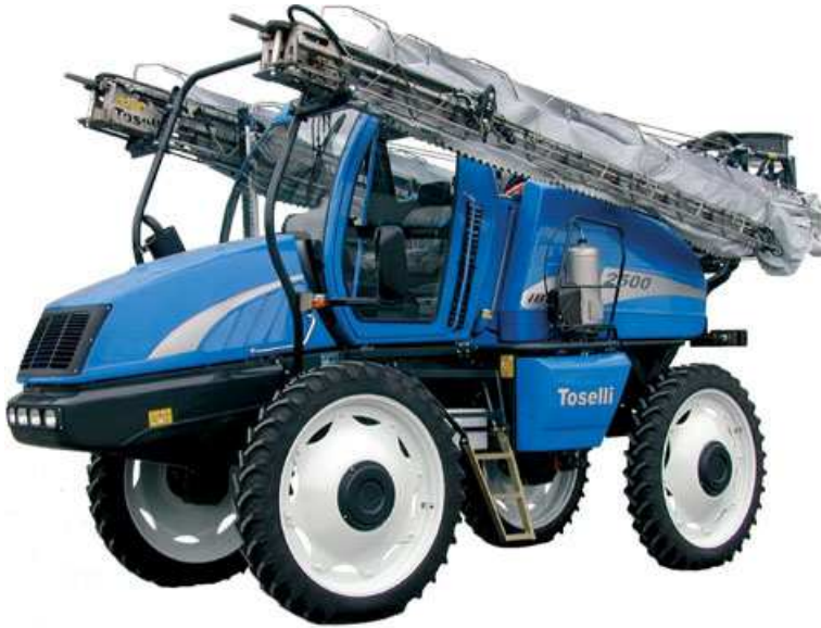
Εικόνα 7 : Αυτοκινούμενο ψεκαστικό

Σημαντικά προβλήματα στις βαμβακοκαλλιέργειες δημιουργούν αρκετά ζιζάνια, μερικά από τα οποία είναι και δυσκολοεξόντωτα. Από τα πιο συνηθισμένα είναι η αγριοντοματιά, αγριομελιτζάνα, αγριάδα, βέλιουρας, λουβουδιά, τάτουλας, ασπράγκαθο, κολλιτσίδα, αγριοβαμβακιά, κύπερη, περικοκλάδα.