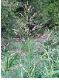
Εικόνα 15 : Βέλιουρας