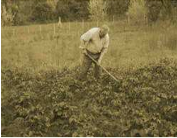
Εικόνα 17 : Σκάλισμα με τα χέρια