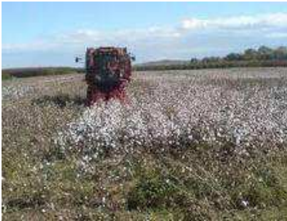
Εικόνα 18 : Σκάλισμα με μηχανικά μέσα