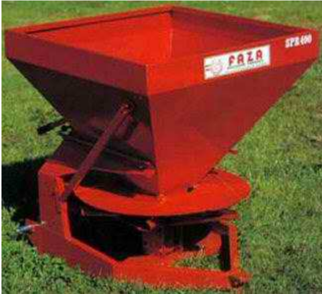
Εικόνα 21 : Λιπασματοδιανομέας

πρώιμων καρποφόρων οργάνων που παρατηρούνται τελευταία σε κάποιες περιοχές, β) να μειωθούν αισθητά οι εισροές στη βαμβακοκαλλιέργεια.