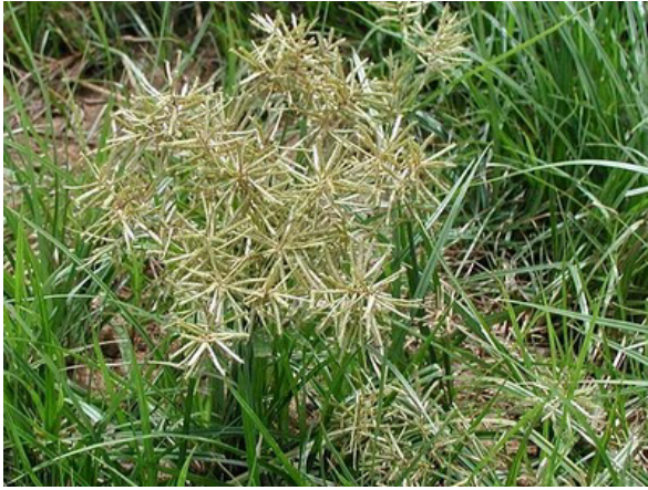
Εικόνα 9 : Κόπερη