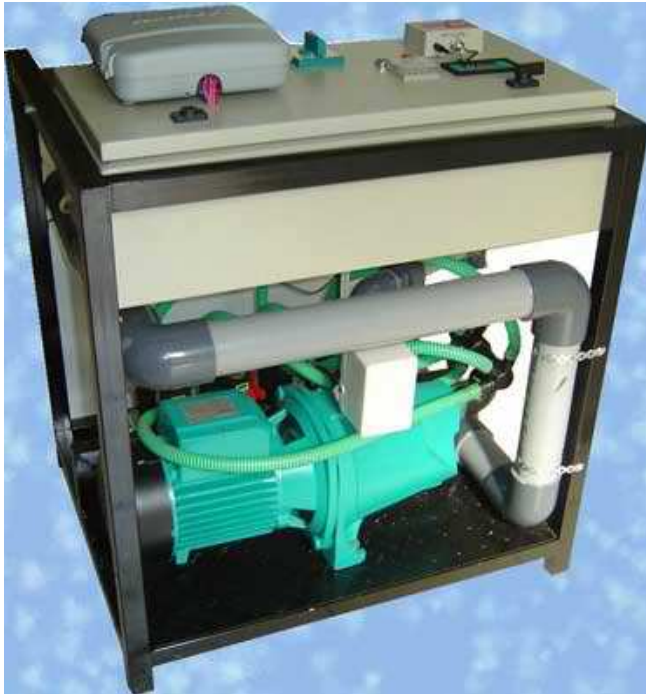
Εικόνα 22 : Κεφαλή Υδρολίπανσης

Για να μπορέσει, όμως να επεκταθεί η μέθοδος της υδρολίπανσης με επιτυχία χρειάζεται από τη μια μεριά να συστηματοποιηθεί η έρευνα, ώστε να υπάρξουν δεδομένα για της ελληνικές συνθήκες, και από την άλλη να ενημερωθούν οι παραγωγοί από ειδικούς γεωπόνους για να αποφευχθούν από την λανθασμένη εφαρμογή της μεθόδου. Γιατί πρέπει να τονιστεί ότι η χρησιμοποίηση της υδρολίπανσης, προϋποθέτει βαθιά γνώση στον τομέα της θρέψης και της λίπανσης των φυτών, καθώς και εμπειρία στη συγκεκριμένη καλλιέργεια.