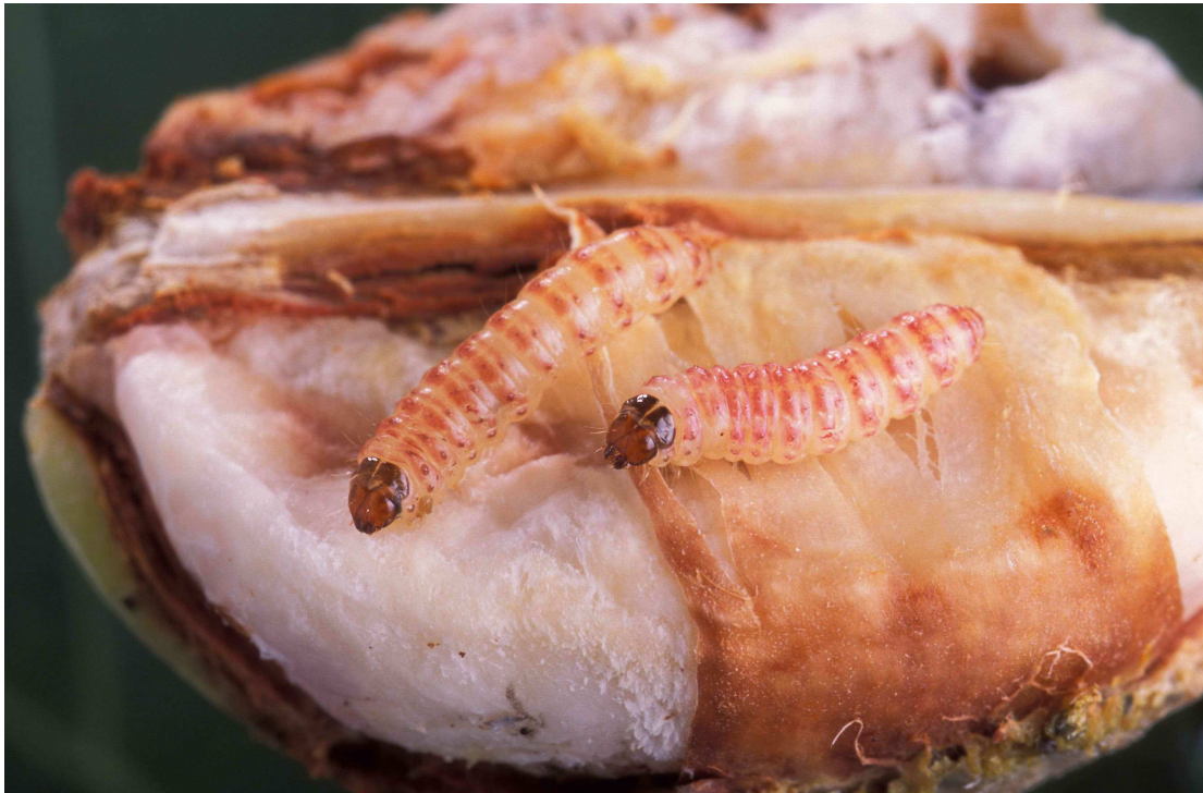
Εικόνα 27 : Ρόδινο Σκουλήκι

Προσβάλλει τα χτένια και τα καρύδια. Τα προσβεβλημένα χτένια πέφτουν ή εξελίσσονται σε λουλούδια που δεν ανοίγουν. Στα καρύδια οι προνύμφες τρώνε τους σπόρους και οι ζημιές που προκαλούν είναι ποσοτικές και ποιοτικές : μειώνετε η βλαστική ικανότητα του σπόρου, η περιεκτικότητα σε λάδι, το μήκος και η αντοχή των ινών.