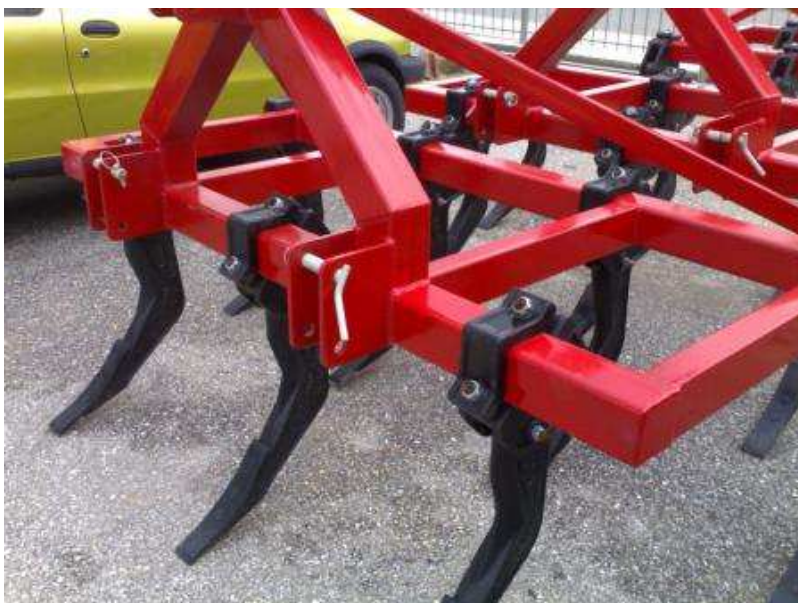
Εικόνα 4 : Υπεδαφοκαλλιεργητής