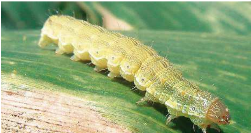
Εικόνα 26 : Πράσινο Σκουλήκι

Η μικρή κάμπια στην αρχή τρέφεται με τρυφερά φύλλα μέχρι να βρεί χτένια, λουλούδια ή καρύδια. Τα χτένια πέφτουν και τα καρύδια τα αφήνουνε συνήθως μισοφαγωμένα και προσβάλλει άλλα, με αποτέλεσμα να αυξάνονται οι ζημιές, αφού τελικά προσβάλλει περισσότερα από αυτά που χρειάζεται για την διατροφή της.