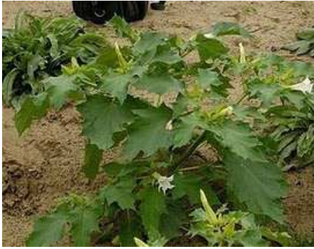
Εικόνα 12 : Τάτουλας