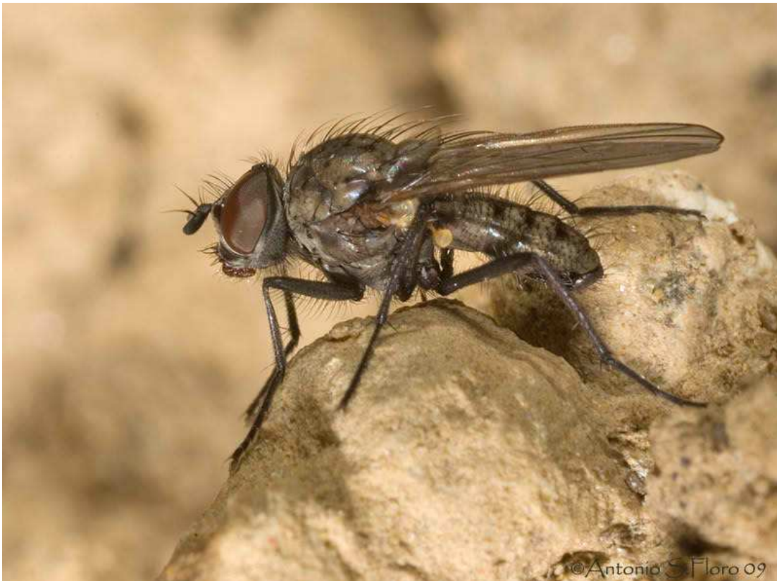
Εικόνα 24 : Υλέμυγα

Προσβάλλει και καταστρέφει τους σπόρους και τα μικρά φυτά πριν βγουν από το έδαφος. Δε θεωρείτε σοβαρός εχθρός του βαμβακιού.