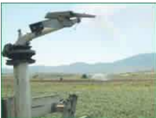
Εικόνα 20 : Πότισμα με σταγόνα

Επιπλέον, χρειάζεται προσοχή στον προγραμματισμό της άρδευσης καθώς το σύστημα είναι ευαίσθητο σε τυχόν λάθη, επειδή ο όγκος που βρέχεται είναι περιορισμένος. Σημειώνεται επίσης ότι ορισμένες ποικιλίες ανταποκρίνονται καλύτερα στην άρδευση με σταγόνες. Μετά από κάθε πότισμα πρέπει να εξετάζεται σε διάφορα σημεία του χωραφιού, σε τι βάθος προχώρησε το νερό του ποτίσματος και πόσο ομοιόμορφα. Η εξέταση γίνεται με μια σιδερένια βέργα, δύο μέρες μετά το πότισμα για τα ελαφρά εδάφη και τέσσερις μέρες για τα βαριά εδάφη.