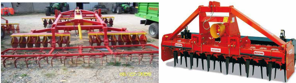
Εικόνα 6 : Δισκοσβάρνα , Σβωλοκόπτης

Το δισκοσβάρνισμα (επιφανειακή κατεργασία του εδάφους) γίνεται την άνοιξη και χρειάζεται μεγάλη προσοχή, ιδιαίτερα στα βαριά και συνεκτικά εδάφη. Στόχος τους είναι να επιτευχθεί το ψιλοχωμάτισμα των σβόλων και να δημιουργηθεί σποροκλίνη κατάλληλη να δεχθεί το σπόρο.