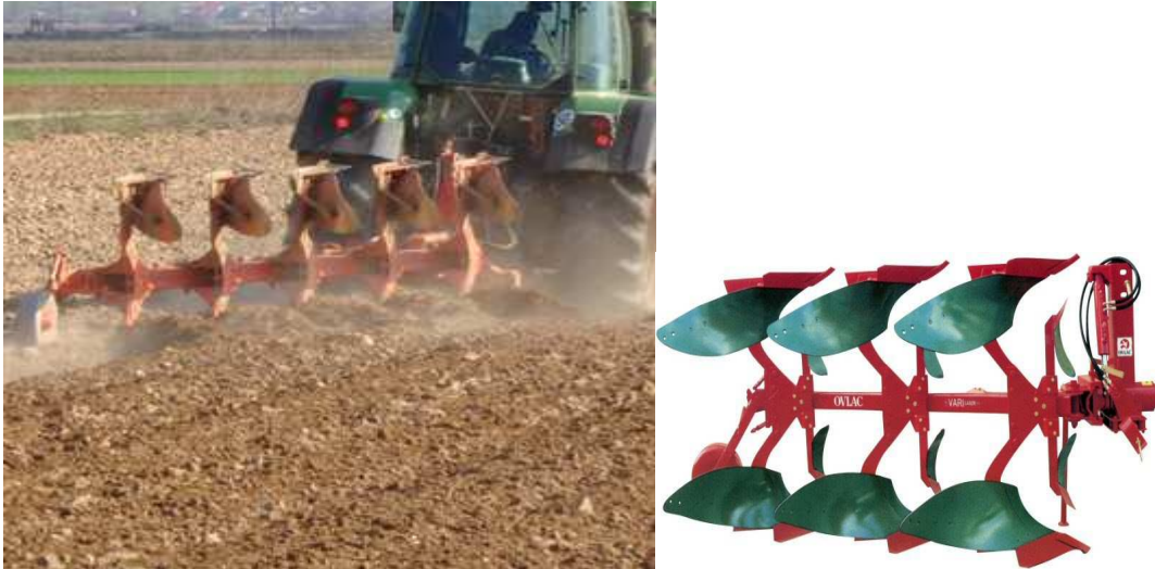
Εικόνα 5 : Άροτρο αναστρεφόμενο

Χρήση καλλιεργητή μετά τις βροχές του χειμώνα, ανακατεύει το χώμα σε αρκετό βάθος, οπότε όχι μόνο αποβάλλεται η περιττή υγρασία, αλλά παράλληλα καταστρέφονται τα ζιζάνια και ισοπεδώνεται-προετοιμάζεται το χωράφι για σπορά.