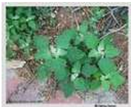
Εικόνα 11 : Λουβουδία