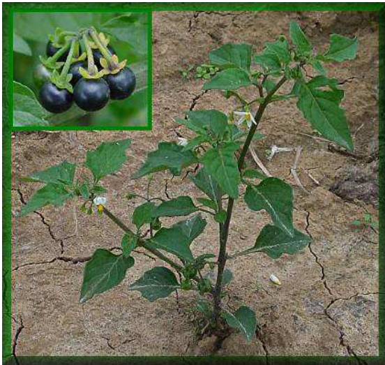
Εικόνα 16 : Αγριοντοματιά