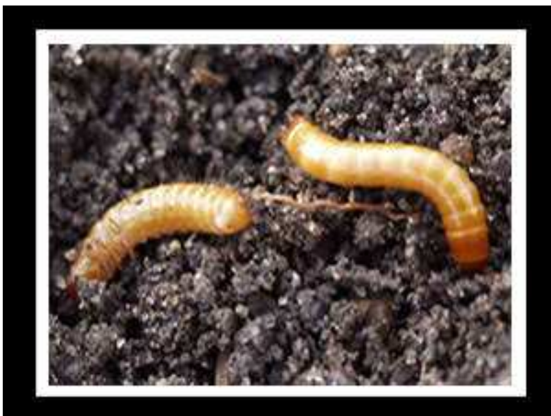
Εικόνα 23 : Σιδηροσκώληκες

Αρχικά προσβάλλουν το σπόρο, τρώνε το περιεχόμενό του και το βλαστίδιο και ο σπόρος να μην φυτρώνει. Μετέπειτα προσβάλλουν τα νεαρά βαμβακόφυτα κοντά στο λαιμό.