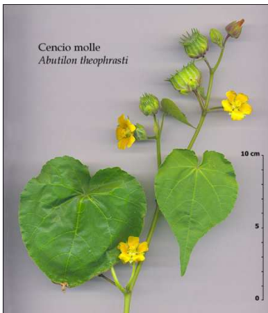
Εικόνα 14 : Αγριοβαμβακιά