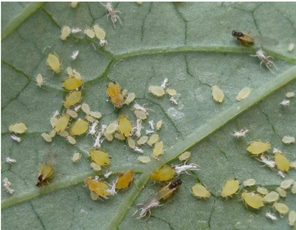
Εικόνα 29 : Τετράνυχος

Οι τετράνυχτοι προσβάλλουν πολλά είδη φυτών, καλλιεργούμενων αλλά και αυτοφυών.