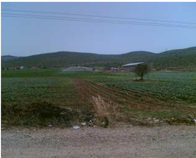
Εικόνα 19 : Πότισμα με τεχνητή βροχή

Το πότισμα με τεχνητή βροχή ενδείκνυται σε χωράφια επικλινή και πορώδη. Επιτρέπει οικονομία και ομοιόμορφη κατανομή του νερού, αξιοποιεί μικρές παροχές αρδευτικού νερού και θεωρείται ο καλύτερος τρόπος για ελαφρά ποτίσματα (φυτρώματος, συντήρησης). Παρόλα αυτά μειονεκτεί γιατί κοστίζει σχετικά ακριβά, παρουσιάζει απώλειες νερού με εξάτμιση, επηρεάζεται από τον άνεμο και απαιτεί αρκετές τεχνικές γνώσεις και πείρα από τον χειριστή.