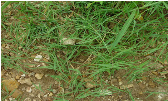
Εικόνα 10 : Αγριάδα