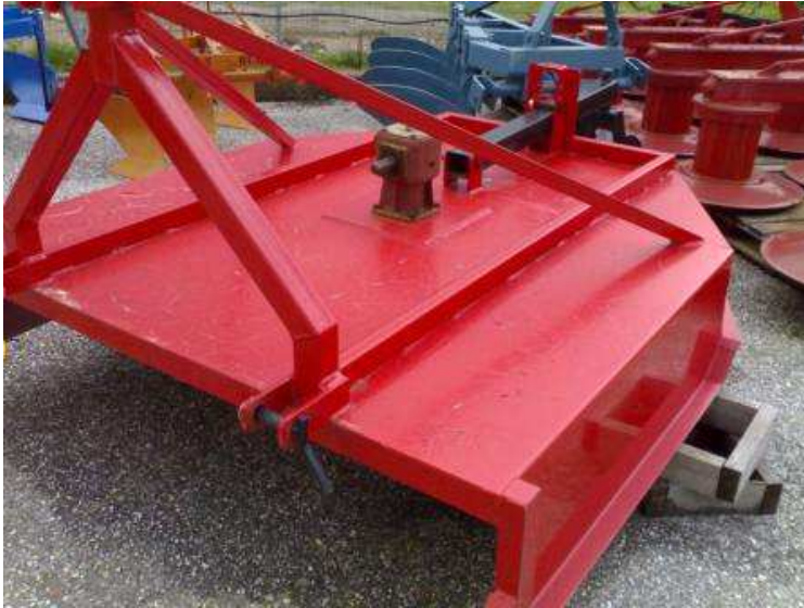
Εικόνα 3 : Στελεχοκόπτης

Το ξερίζωμα και το κάψιμο είναι εργασία δαπανηρή και στερεί το χωράφι από την πολύτιμη οργανική ουσία και τα ανόργανα στοιχεία. Ενδείκνυται μόνο για την καταπολέμηση ασθενειών.