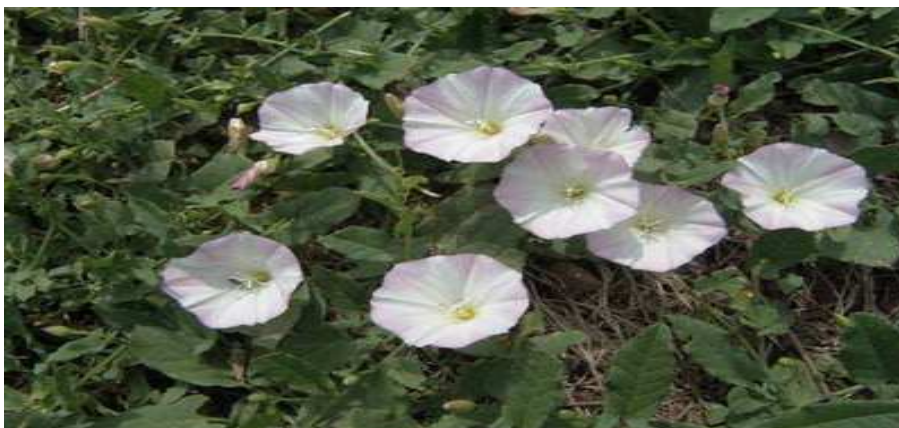
Εικόνα 8 : Περικοκλάδα

Σημαντικά προβλήματα στις βαμβακοκαλλιέργειες δημιουργούν αρκετά ζιζάνια, μερικά από τα οποία είναι και δυσκολοεξόντωτα. Από τα πιο συνηθισμένα είναι η αγριοντοματιά, αγριομελιτζάνα, αγριάδα, βέλιουρας, λουβουδιά, τάτουλας, ασπράγκαθο, κολλιτσίδα, αγριοβαμβακιά, κύπερη, περικοκλάδα.