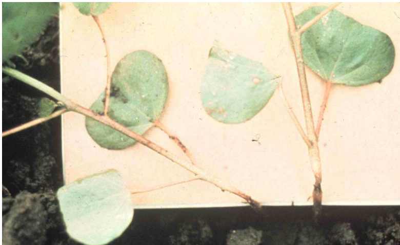
Εικόνα 31 : Τήξεις Φυταρίων

Προσβάλλουν το σπόρο και τα νεαρά βαμβακόφυτα και προκαλούν σάπισμα του σπόρου η της ρίζας. Στη ρίζα, στο ύψος της επιφάνειας του εδάφους δημιουργούνται περιφερειακές ή επιμήκειες καστανές μέχρι μαύρες κηλίδες. Τελικά τα νεαρά φυτά νεκρώνονται.